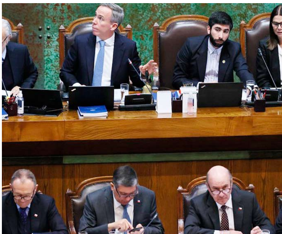
El Gobierno se anotó un triunfo tras una extensa y tensionada sesión en la Cámara de Diputados.