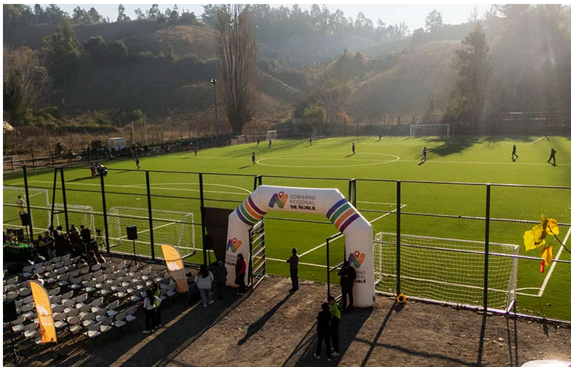
Coelemu estrenó su nuevo recinto en Guarilihue que beneficiará a 11 clubes y un liceo rural.

76% de avance alcanzó el programa del Gobierno Regional, que supera los $7.000 millones, consolidando una red de espacios públicos para el deporte, la educación y la inclusión en toda la región.