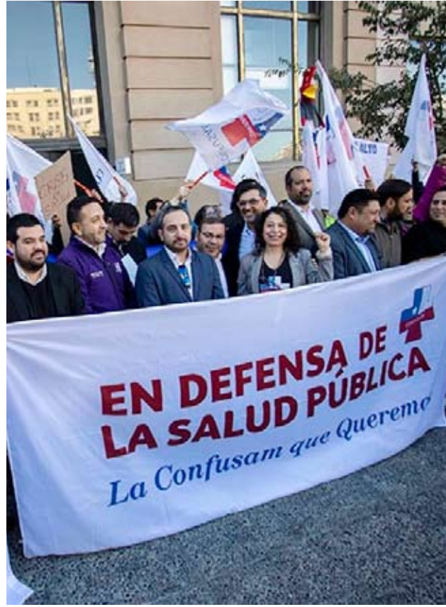
Confusam anunció estado de alerta nacional en atención primaria.

En ese contexto, Confusam anunció el inicio de un estado de alerta nacional en la atención primaria, además de la entrega formal de una carta de rechazo a las medidas adoptadas por el Gobierno.