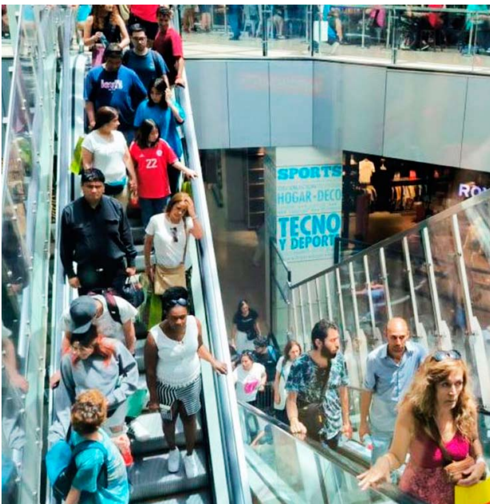
El consumo y los servicios mostraron cifras positivas, aunque no lograron evitar el retroceso.

Testigos del hecho señalaron que el imputado habría tenido un "día de furia", reaccionando de manera agresiva durante el incidente. Sin embargo, aseguraron que al momento de su detención no opuso resistencia ni mantuvo la misma actitud violenta.