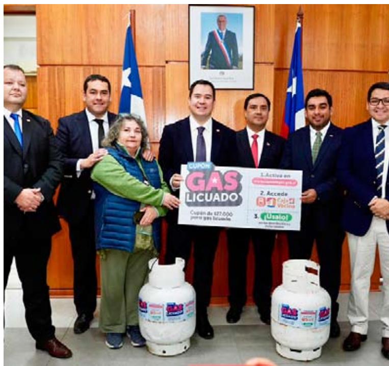
El cupón de gas licuado se debe activar entre el 18 de mayo y el 30 de junio.

Finalmente, hizo un llamado a la ciudadanía a informarse a través de las oficinas de la Delegación Presidencial Regional, las seremis de Gobierno, Desarrollo Social y Familia, Energía, sucursales de ChileAtiende o directamente en el sitio oficial del programa.