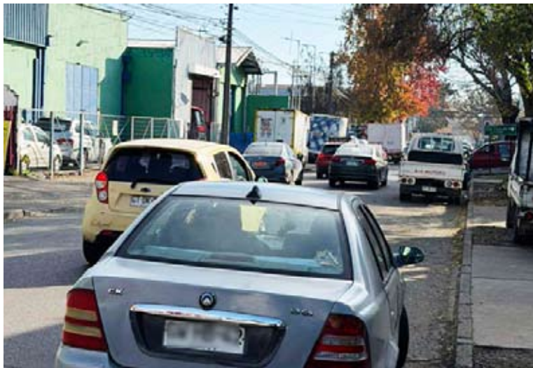
La petición fue presentada durante la última sesión del concejo municipal.

Para el sector, es complejo trabajar en horario nocturno, ya que algunos comerciantes ha sido víctimas de robos. “Me contactaron de la empresa de alarmas que cortaban los cables de la luz. Entonces, cortaron toda la cuadra. Vienen en una camioneta con escalera, con un tape, con una persona que corta los cables de redes, de internet, de todo, de la luz, y después ellos esperan que se descargue la batería de la alarma e intentan robar. La empresa de alarmas me