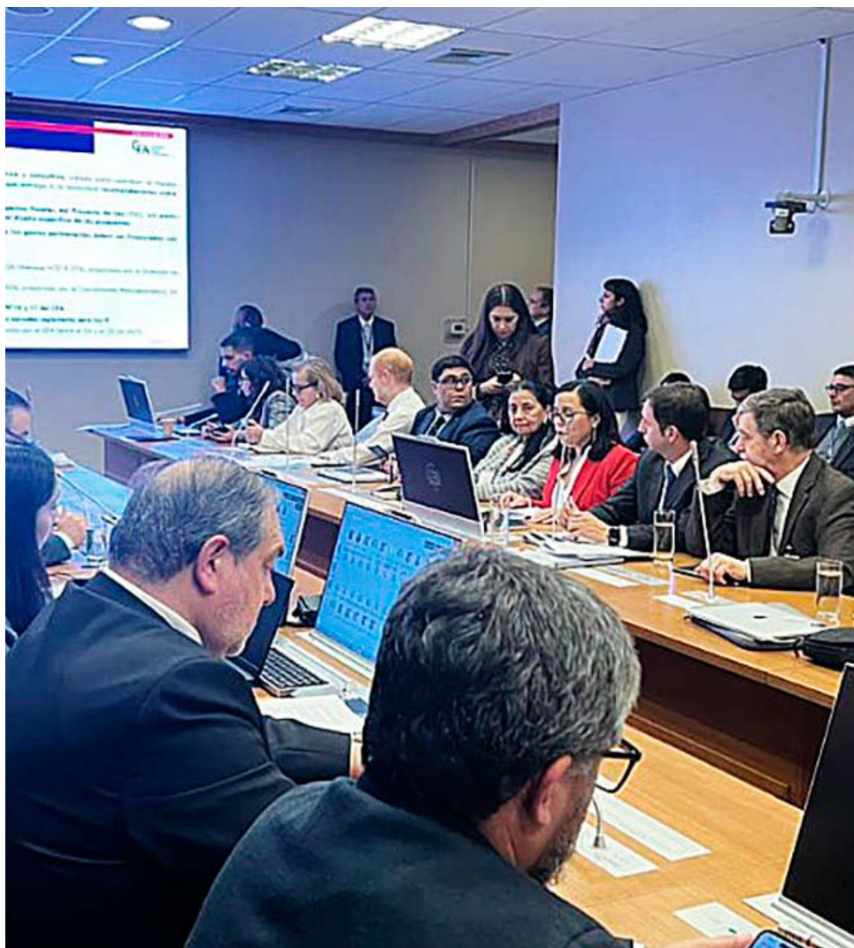
El Consejo Fiscal Autónomo (CFA) expuso ante la Comisión de Hacienda de la cámara.