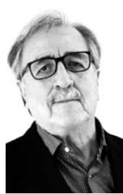
Claudio Martínez Cerda Arquitecto

C on motivo de la celebración del Día del Libro, se llevó a cabo en el Teatro Municipal de Chillán un acto tan extraordinario como virtuoso y único. Isabel Parra, hija de Violeta Parra, figura fundamental en la nueva canción chilena, lanzó un libro póstumo de nuestra muy ñublensina Violeta Parra, sin duda alguna la figura de las artes y el patrimonio más universal de Chile, junto a Pablo Neruda.