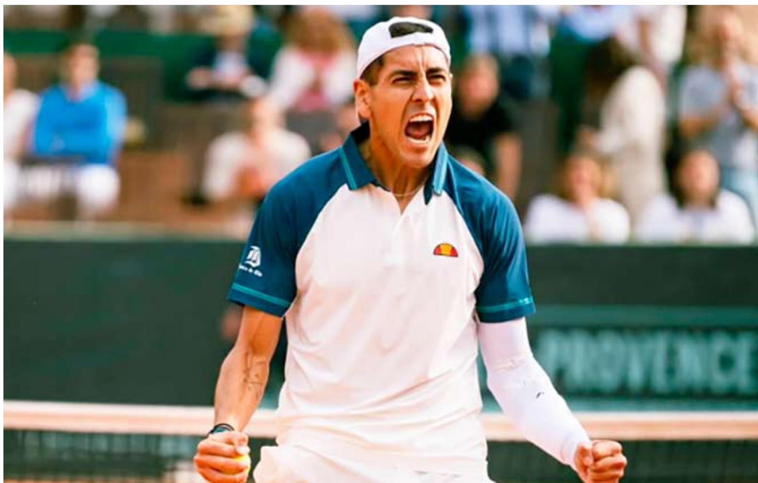
Corresponde al título número 13 de su carrera, en singles.

y se quedó con la manga -y el triunfo- por 6-3. Lo celebró con el mismo salto que Bergs realizó durante todo el partido.