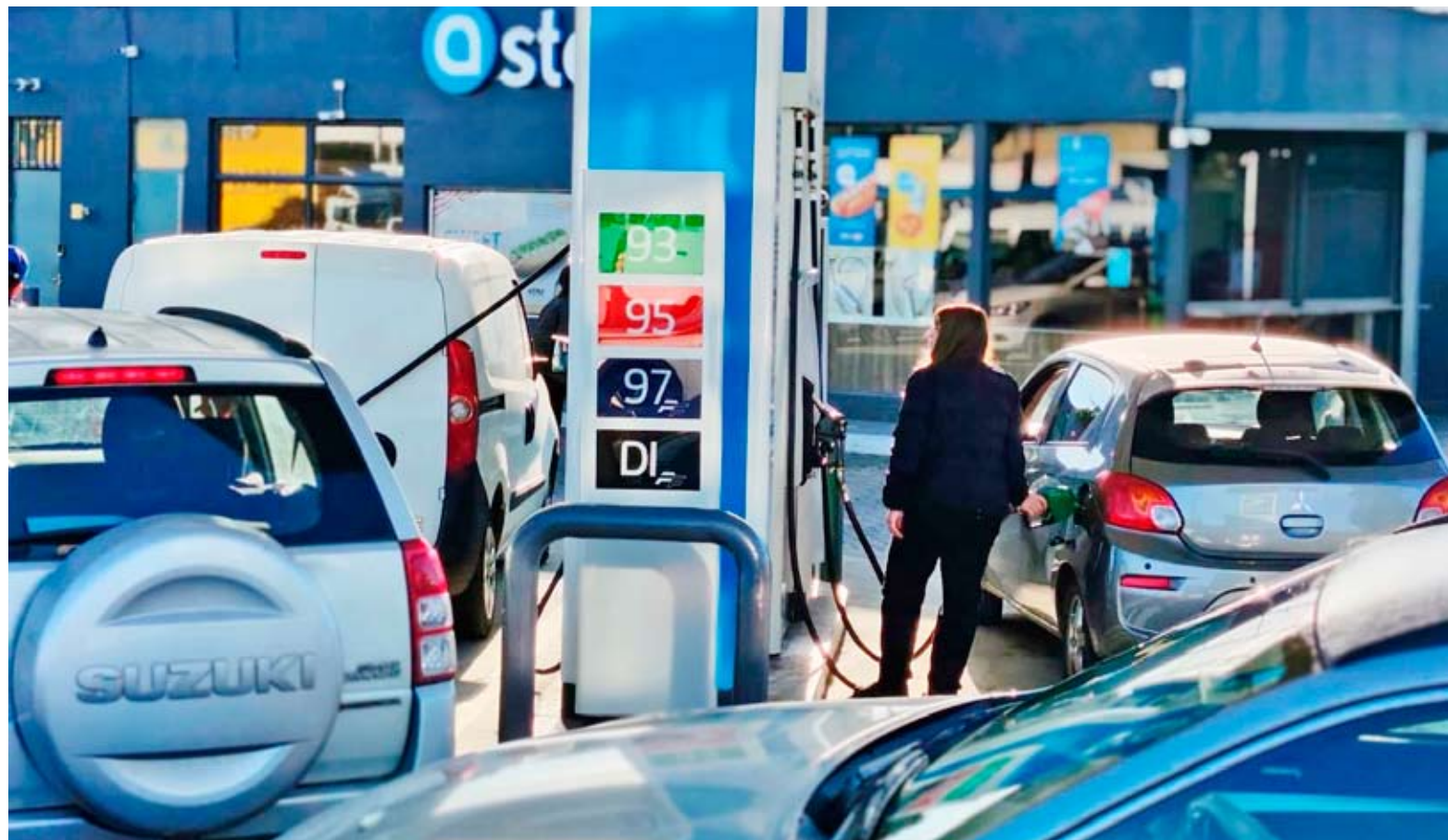
Los chillanejos comenzaron a repletar las bencineras una vez conocido el anuncio del alza del combustible.

El diputado ind.-DC, Felipe Camaño fue categórico al sostener que “usar el vehículo no es un privilegio, es una necesidad”,