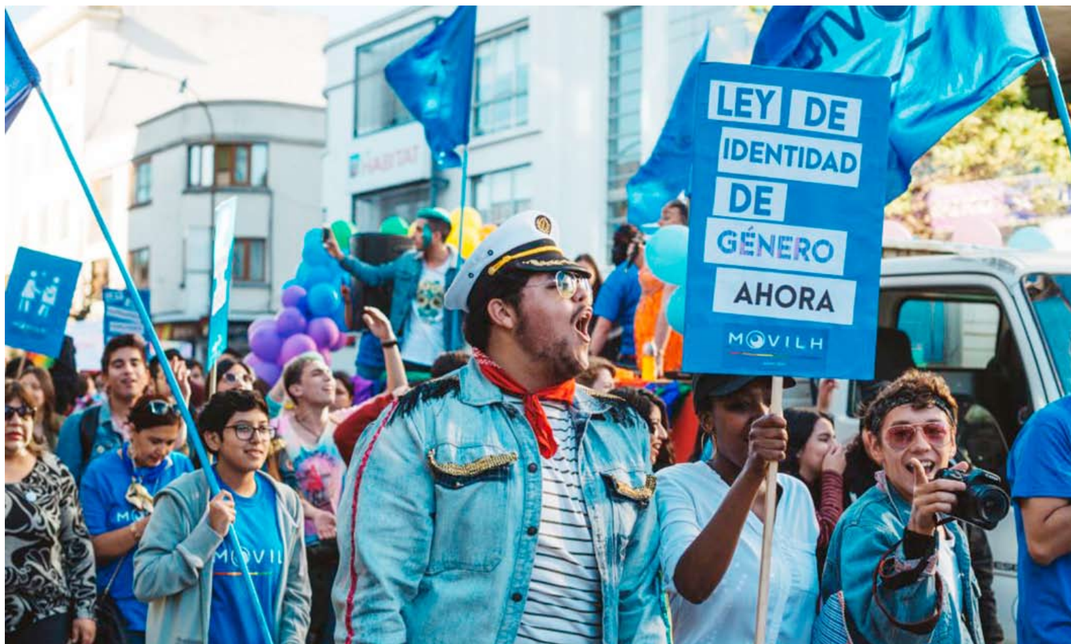
Comunas como Chillán, Ñiquén o Cobquecura figuran entre las que más denuncias concentraron denuncias durante el 2025, en la Región de Ñuble.

En paralelo, desde las organizaciones surge una mirada crítica respecto del tratamiento del tema en el debate público. Gómez sostuvo que durante los últimos años se produjo una fuerte carga ideológica en torno a estas materias, lo que, a su juicio, terminó distorsionando el objetivo central. “Cuando se