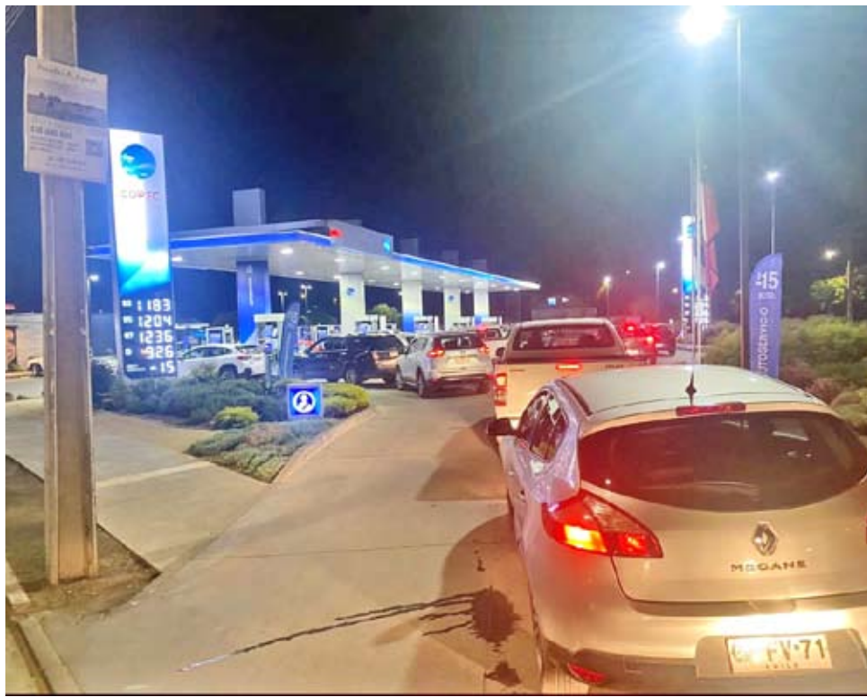
El ajuste comenzará a regir este jueves y ya provocó masivas filas en estaciones de servicio.

Además, puso énfasis en el oficio revelado: "Se señala expresamente un RUT y una causa como el 'Clan Chen', lo que debe aclararse, porque una cosa es el rol como fiscal y otra distinta es la función en seguridad pública", advirtió.