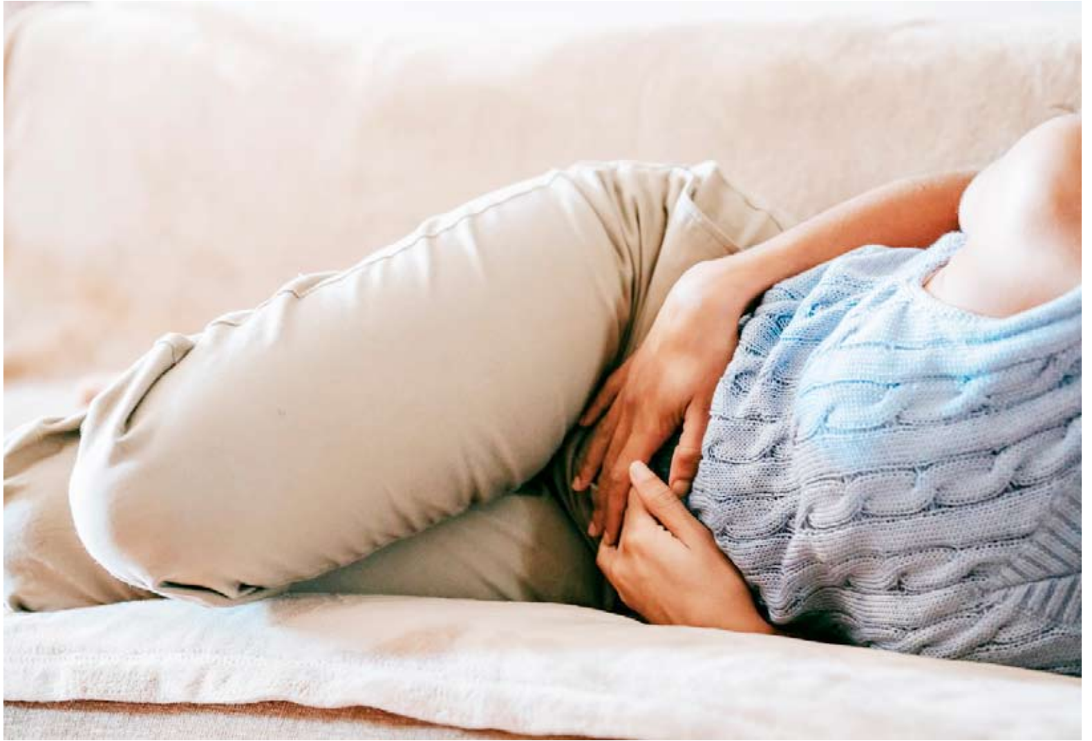
La calidad de vida de las personas con endometriosis se ve afectada en varios aspectos.

Además de estos cambios, la endometriosis se trata con medi-