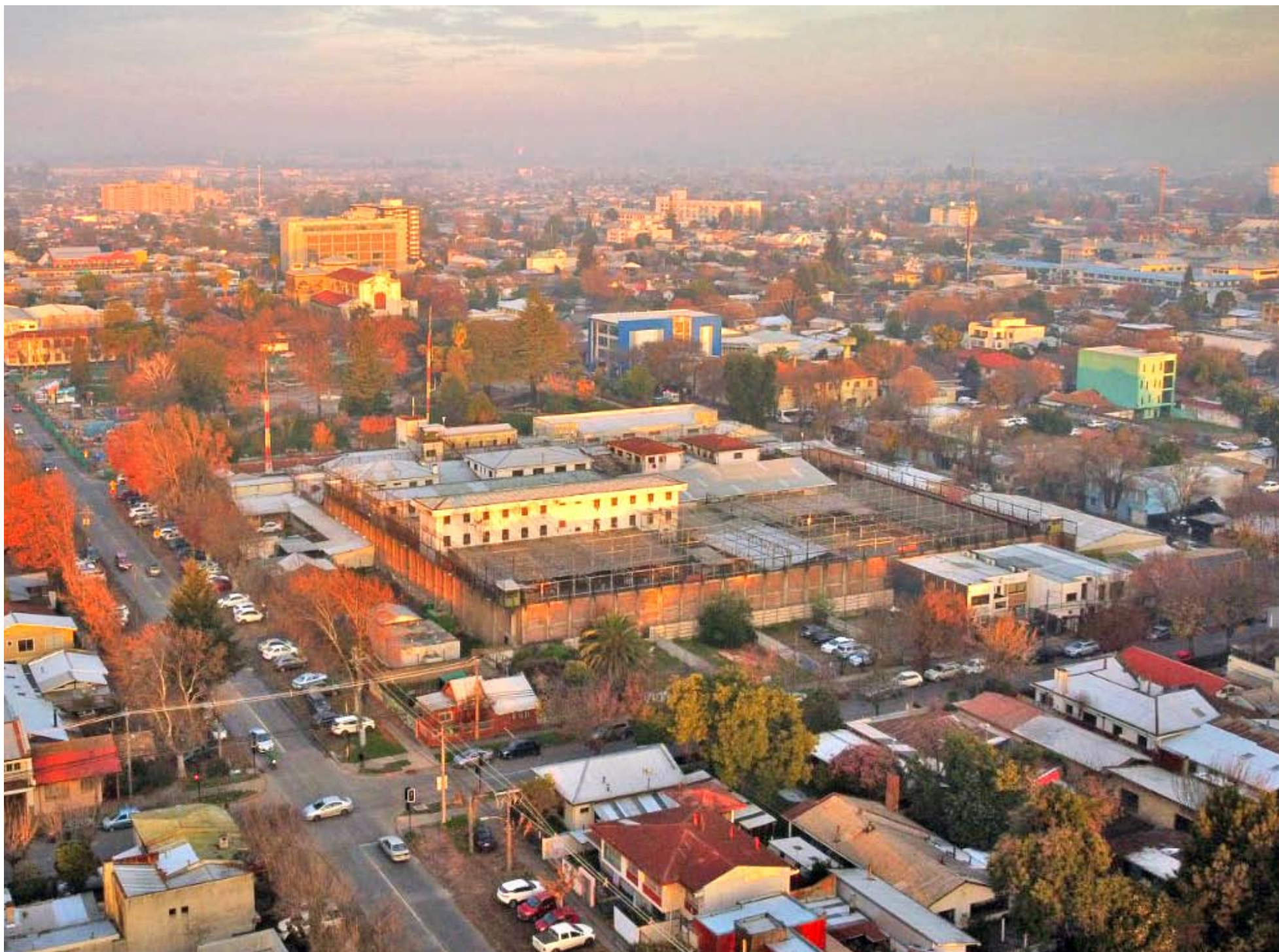
Hoy la cárcel de Chillán mantiene una población penal cercana a los 850 internos, pese a que su capacidad real es de 340 personas. La futura cárcel promete 2.500 plazas.

Conforme a lo manifestado por Diego Sepúlveda, el plazo autoimpuesto para decidir -de manera definitiva- el sitio del futuro recinto de reclusión, será el año 2027.