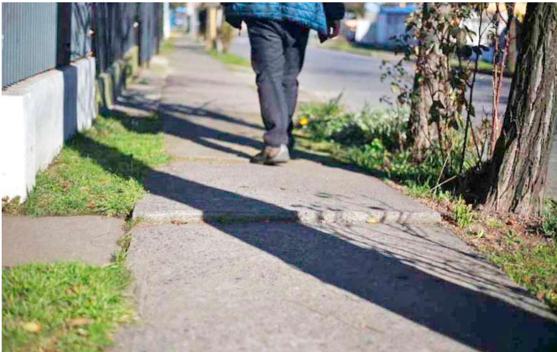
La Villa Kennedy tiene 65 años de construcción y las veredas están en pésimas condiciones.

años de historia tiene la Villa Kennedy, lo que ha generado complicaciones en sus veredas, debido a las raíces de los añosos árboles del sector.