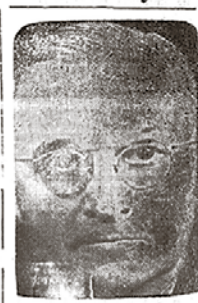
El Presidente Truman, que pronunció el discurso de clausura de la Conferencia de las Naciones Unidas.

SAN FRANCISCO, 26 (U.P.). — En su discurso de clausura de la Conferencia de las Naciones Unidas el Presidente de Estados Unidos, señor Harry S. Truman, expresó en las partes principales: "Os reunisteis en San Francisco hace nueve semanas como símbolo de esperanza y confianza de los pueblos amantes de la paz en el mundo entero. Habéis justificado esa confianza. Habéis satisfecho la esperanza en vuestro triunfo. La Carta de las Naciones Unidas que acabáis de firmar es una sólida estructura sobre la cual podremos edificar un mundo mejor. La historia os honrará por ello. "Entre la victoria en Europa y la victoria final sobre el Japón, en la más destructiva de todas las guerras, habéis conseguido una victoria contra la guerra en sí. Fue la esperanza de la Carta lo que contribuyó a sostener el valor de los pueblos afligidos en el curso de los días más negros de la historia. Porque es una declaración de gran fe hecha por las naciones de la tierra, fe en que la guerra no es inevitable, fe en que es posible mantener la paz. Si hubiéramos tenido esta Carta hace unos cuantos años, por en-