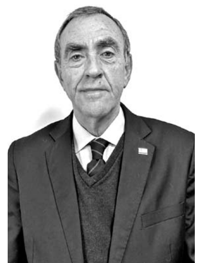
EDMUNDO NOVOA PUGA SEREMI DEL TRABAJO Y PREVISIÓN SOCIAL

Chile lleva más de 100 años postergando esa respuesta. Ya era hora.