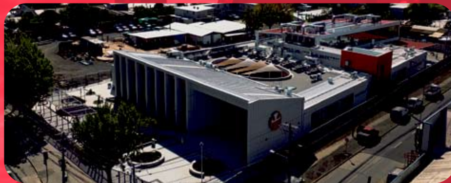
Construcción y equipamiento del Instituto Teletón