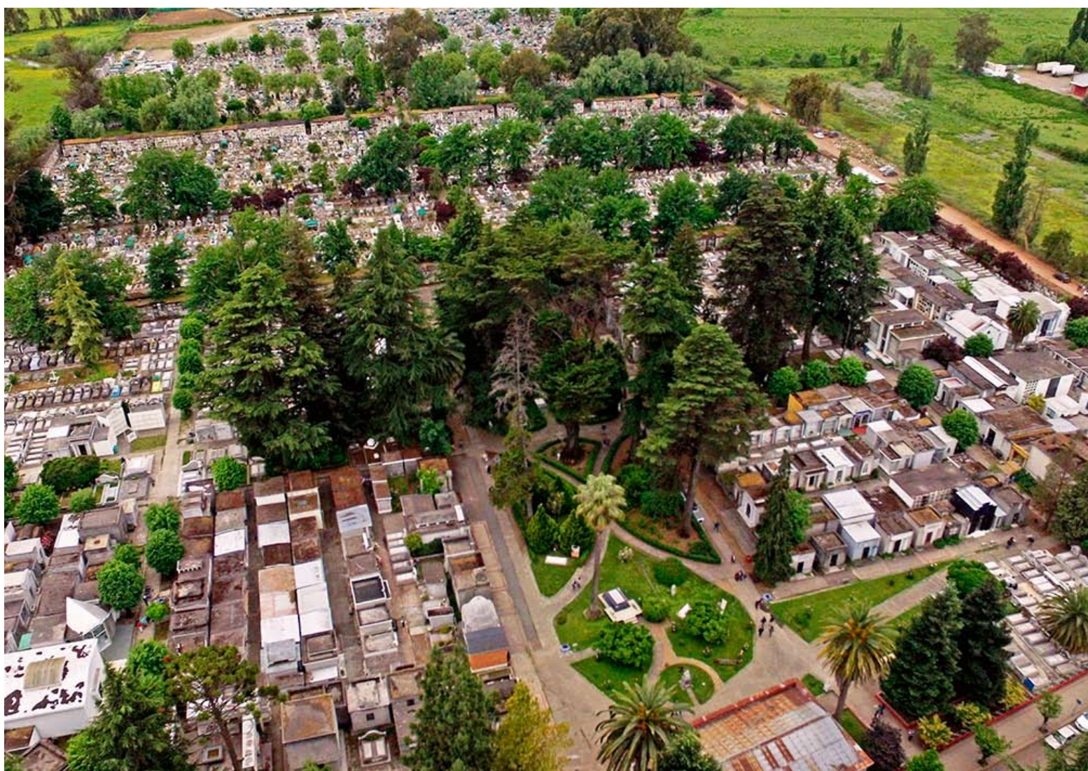
Uno de los sectores emblemáticos es el denominado Patio de los Artistas.

Con más de 120 años de existencia, el Cementerio Municipal de Chillán continúa siendo mucho más que un lugar de sepultación. Entre mausoleos centenarios, memoriales, esculturas y tumbas de personajes ilustres, el recinto conserva una parte esencial de la identidad de la ciudad y de la historia de quienes la han construido a lo largo de generaciones.