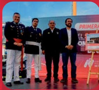
Construcción 5ª Compañía de Bomberos "Pompe France"