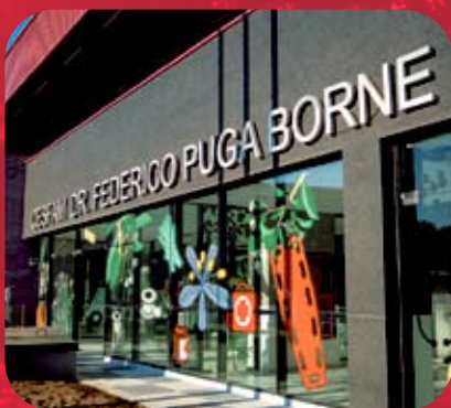
Construcción del Cesfam Federico Puga