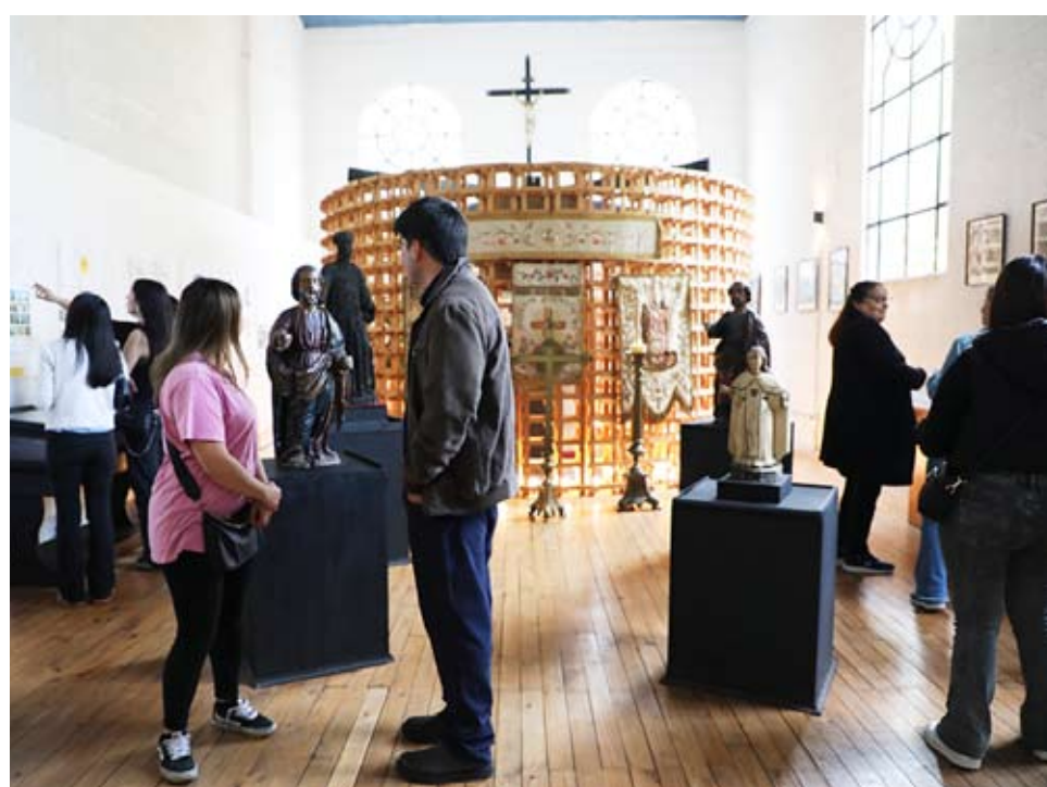
La Orden Franciscana en Chillán sigue viva a través del patrimonio religioso que alberga.

La restauración integral del convento sigue siendo una tarea pendiente que requiere importantes recursos económicos y una coordinación entre distintas instituciones para garantizar la preservación de este legado para las futuras generaciones.