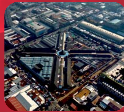
Remodelación Patio Isabel Riquelme