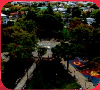
Remodelación Plaza San Francisco

Desde el Gobierno Regional estamos trabajando para cambiar la vida de las personas con proyectos emblemáticos que ya son realidad