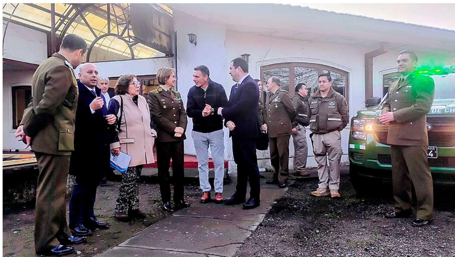
Se espera que en los primeros meses del próximo semestre ya esté la casona completamente acondicionada para el trabajo del Labocar.

La unidad de investigación estará en esas dependencias por dos años, mientras se busca traspasarles un predio municipal para su asentamiento definitivo en el sector de Vicente Méndez. Durante ese periodo, el arriendo del inmueble será asumido por el consistorio.