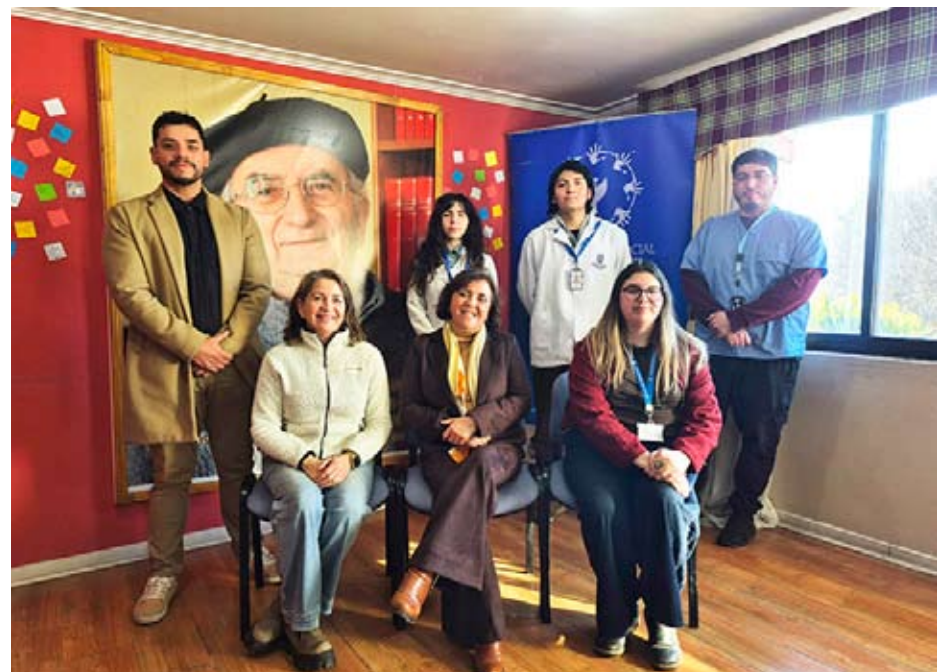
Decana junto a estudiantes en práctica y equipo del CEPSICO UBB, en el marco del trabajo formativo y de vinculación.

Actualmente, CEPSICO UBB es un espacio de atención, aprendizaje y compromiso social al servicio de la región de Ñuble.