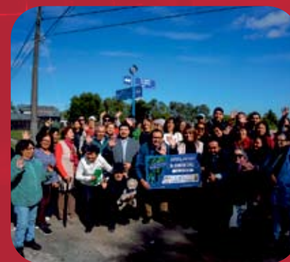
Diseño Ampliación Avenida Reino de Chile