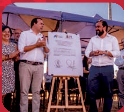
Mejoramiento del Alcantarillado de Rucapequén