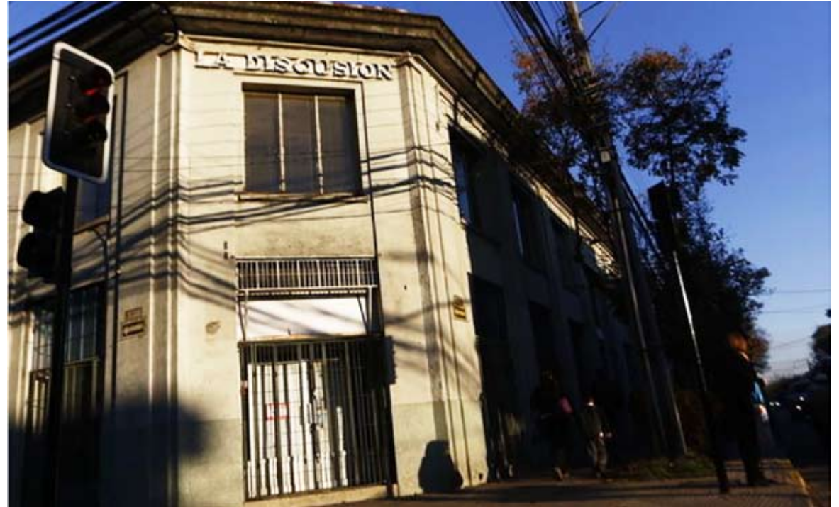
El edificio de La Discusión, Inmueble de Conservación Histórica, fue construido después del terremoto de 1939.

Sus páginas dieron cabida a académicos, dirigentes sociales, empresa-