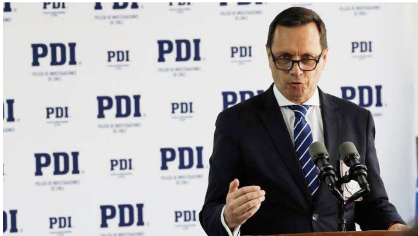
Los menores fueron reportados como desaparecidos tras ingresar al país mediante vuelos chárter en 2025.

Sin embargo, para Pommer, el diseño actual de estas medidas adolece de un error estructural catastrófico: la falta de financiamiento y la exclusión de los científicos del debate.