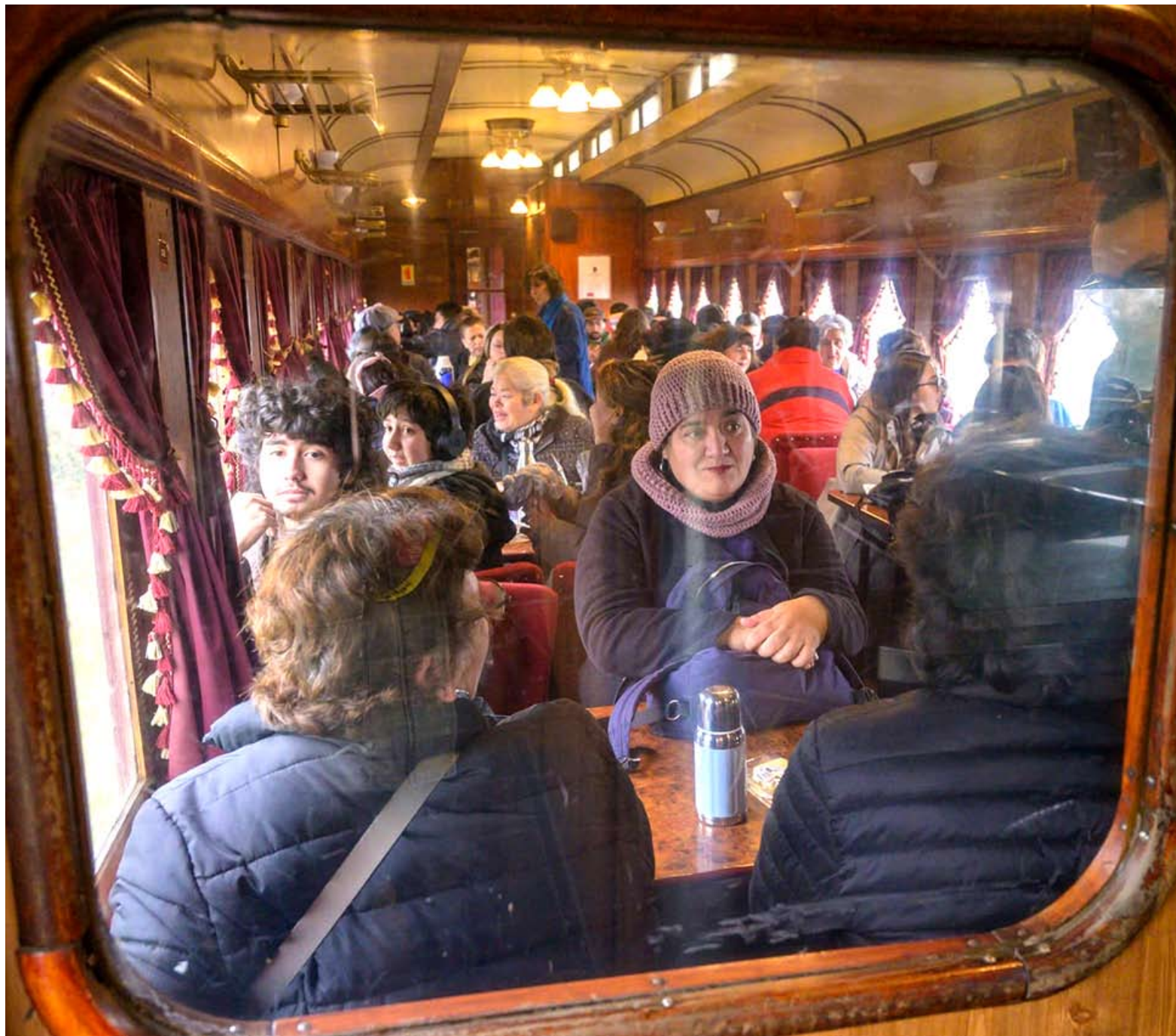
El 31 de mayo, después de casi cuatro décadas, un tren de pasajeros volvió a recorrer el ramal hacia Quinchamalí y Confluencia.

“Una eventual reactivación abre nuevas posibilidades para las comunidades del territorio. Las alfareras de Quinchamalí y Santa Cruz de Cuca, reconocidas a nivel internacional por la Unesco, podrían fortalecer la difusión y comercialización de su trabajo. Del mismo modo, las comunidades agroproductivas, los emprendimientos locales y el comercio podrían beneficiarse de un mayor flujo de visitantes y de