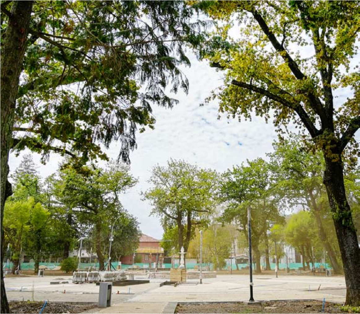
la municipalidad apunta a recuperar uno de los espacios públicos más emblemáticos de Chillán.

SERÁ ENTREGADA DURANTE EL PRIMER SEMESTRE