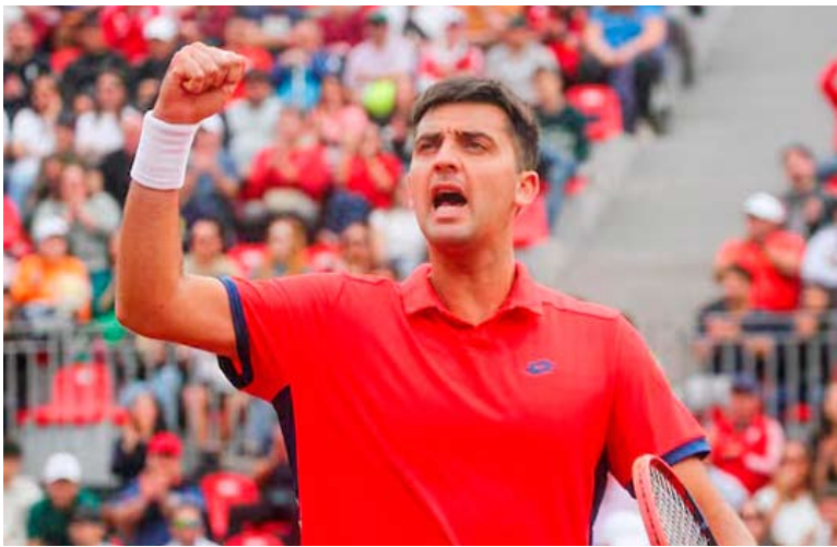
Barrios intentará derribar a uno de los favoritos del torneo argentino.

Sin embargo, el reto de esta jornada será mayor. Darderi atraviesa uno de los mejores momentos de su carrera y, por ranking y presente competitivo, asoma como amplio favorito. El italiano se ha consolidado en el circuito ATP gracias a su potencia desde el fondo y regularidad en torneos sobre polvo de ladrillo, lo que anticipa un duelo exigente para el chileno.