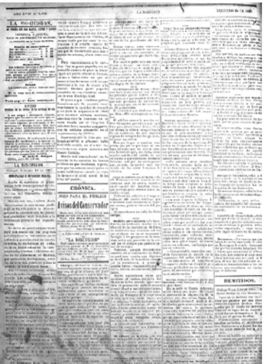
10-02-1887 Epidemia de cólera en Chile llega a Chillán