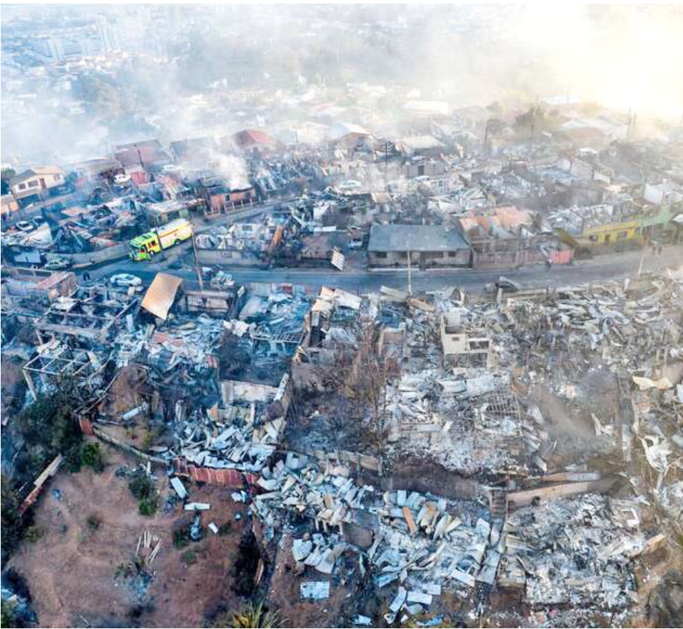
La Fiscalía abrió causa por uso irregular de más de $1.100 millones.

De acuerdo con los antecedentes preliminares, los montos observados superarían los 1.100 millones de pesos, asociados a intervenciones en cerca de un centenar de viviendas afectadas por el siniestro. Debido a la gravedad de los hechos y a la eventual existencia de delitos, los antecedentes fueron remitidos a la Fiscalía Regional de Valparaíso