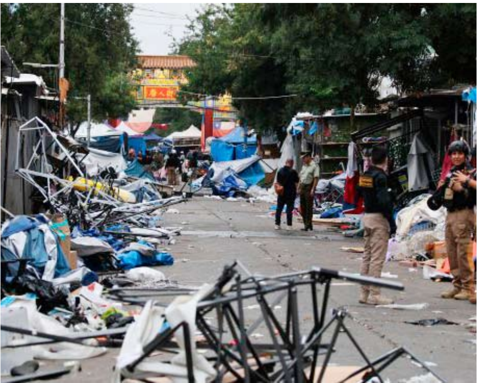
Algunos comerciantes expresaron su disposición a retirarse de forma pacífica.

Sobre la fecha para desalojar el sector, Durán planteó que "ese es el compromiso que asumimos, requiere varias cosas, no solo el recurso policial disponible, sino que habilitación de las rejas, es una cosa que se ve de manera colaborativa con la Cámara de Comercio. Nuestra idea es cumplir con aquello y vamos a trabajar con el propósito de que el 10 de marzo digamos que la manzana de Meiggs