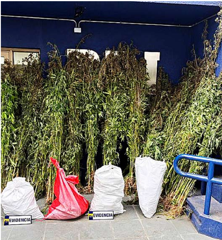
La plantación estaba dentro de un predio forestal.