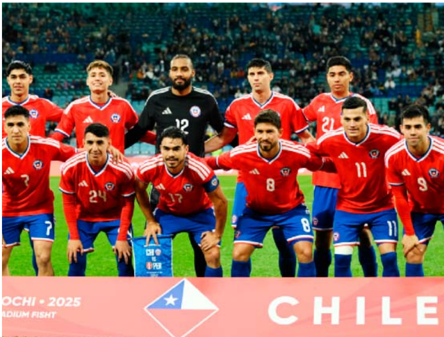
Duelos se suman a los ya planificados contra otros dos elencos que dirán presente en la Copa del Mundo: Cabo Verde y Nueva Zelanda, en marzo.

El gerente, explicó los objetivos que tienen para este periodo. “El mundial del 2030 es el enfoque que tienen nuestros objetivos en todas las selecciones”.