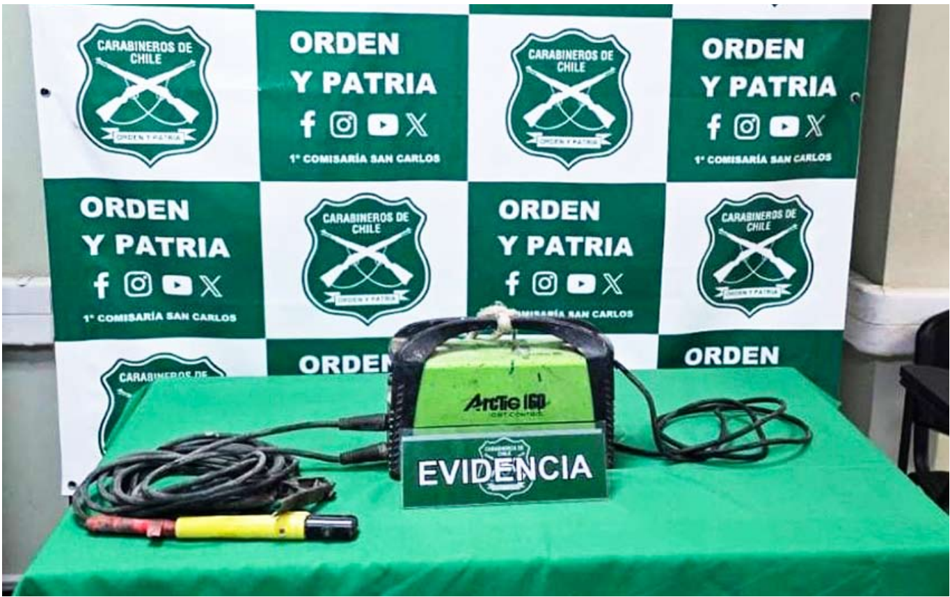
En el procedimiento, Carabineros además incautó una máquina soldadora.

Las indagatorias permitieron establecer que el origen del incendio estaría relacionado con trabajos de soldadura realizados en el portón de ingreso a una parcela, maniobras que habrían generado chispas que dieron inicio al fuego, el cual posteriormente