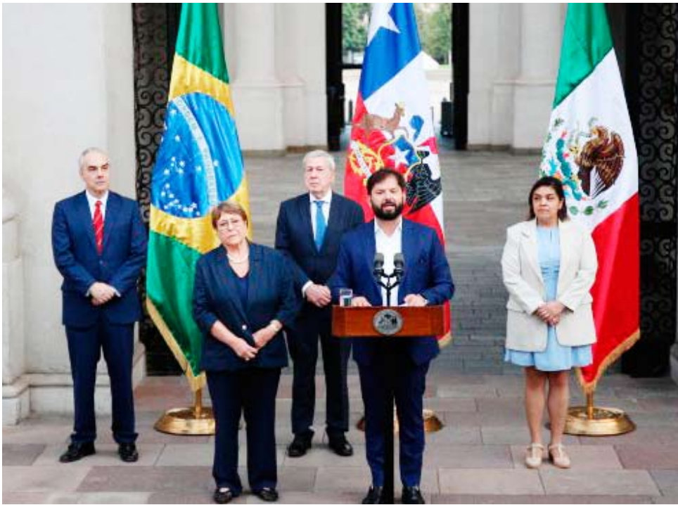
Con el centenario de la ONU en el horizonte, la candidata enfatizó que la organización no puede depender exclusivamente de sus logros pasados.

El Presidente Boric realizó un extenso repaso por la carrera de Bachelet, subrayando su experiencia previa en cargos de alta relevancia internacional, como la dirección de