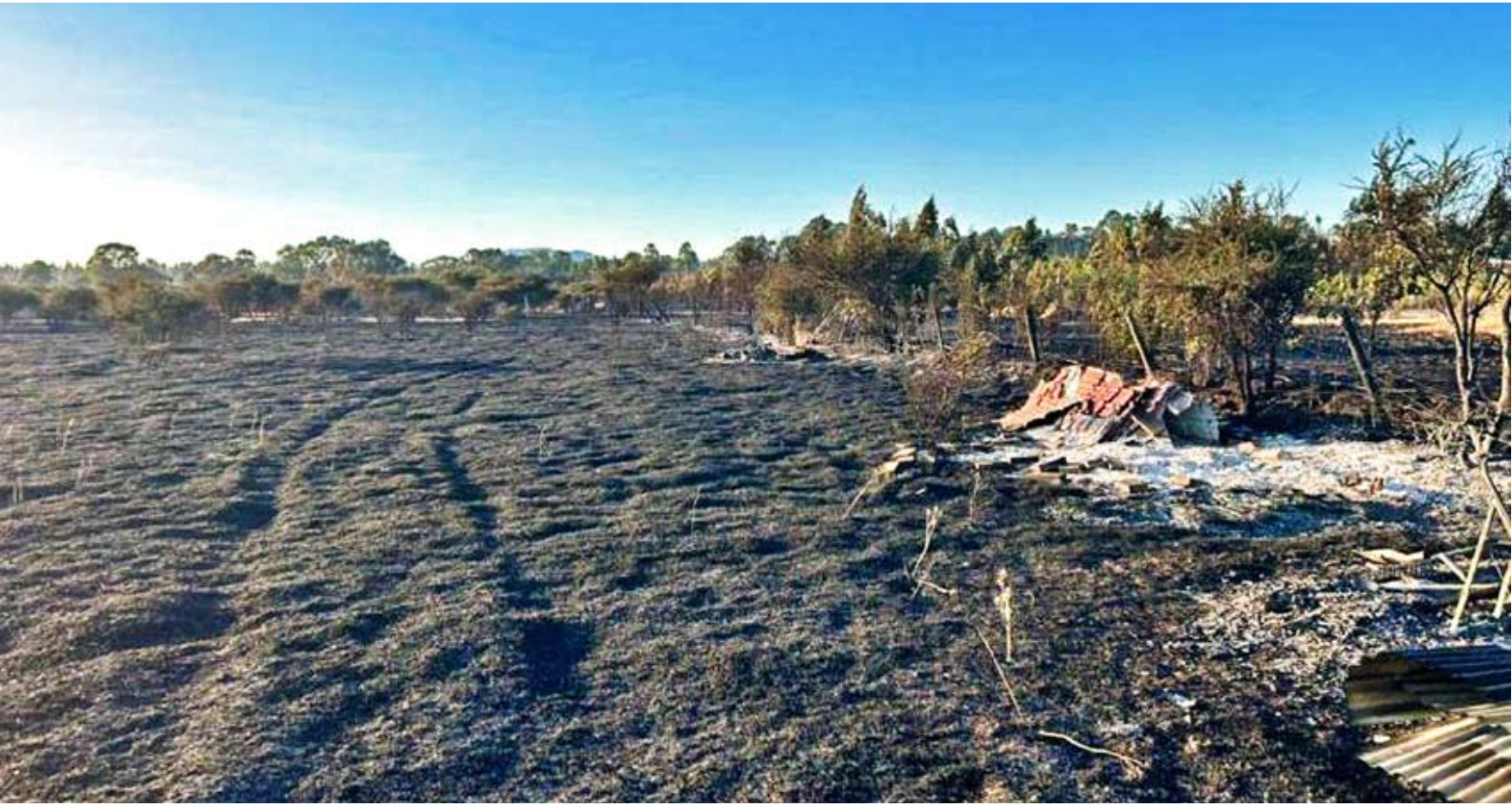
En cuanto a la afectación son 9.547 hectáreas, representa un 300% de aumento en comparación al año anterior.

En el periodo 2025-2026 van 311 incendios forestales, cifra un 20% más que la misma fecha de la temporada pasada.