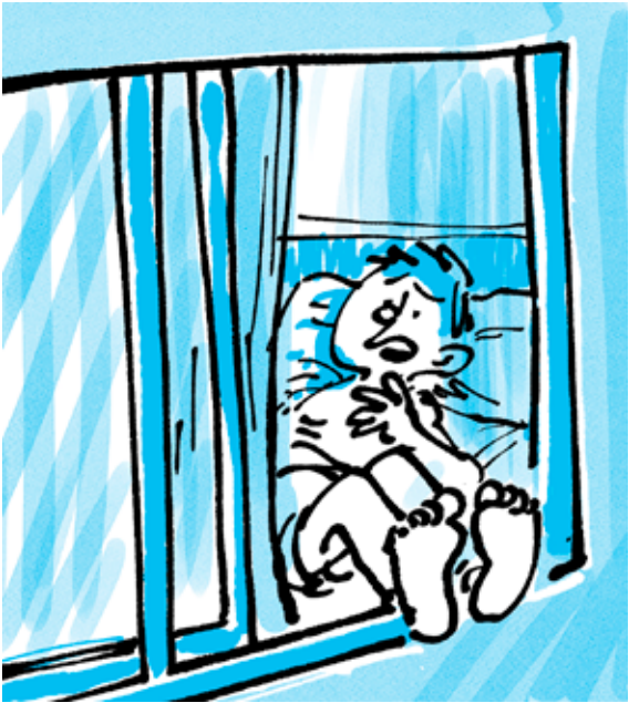
- El próximo año si que pongo aire acondicionado