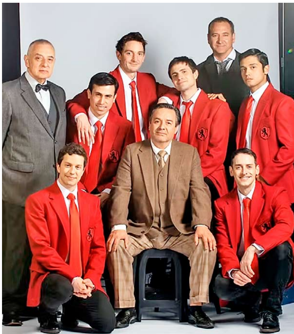
La obra de teatro se presentará este sábado 31 de enero con entrada liberada, previo retiro de estas