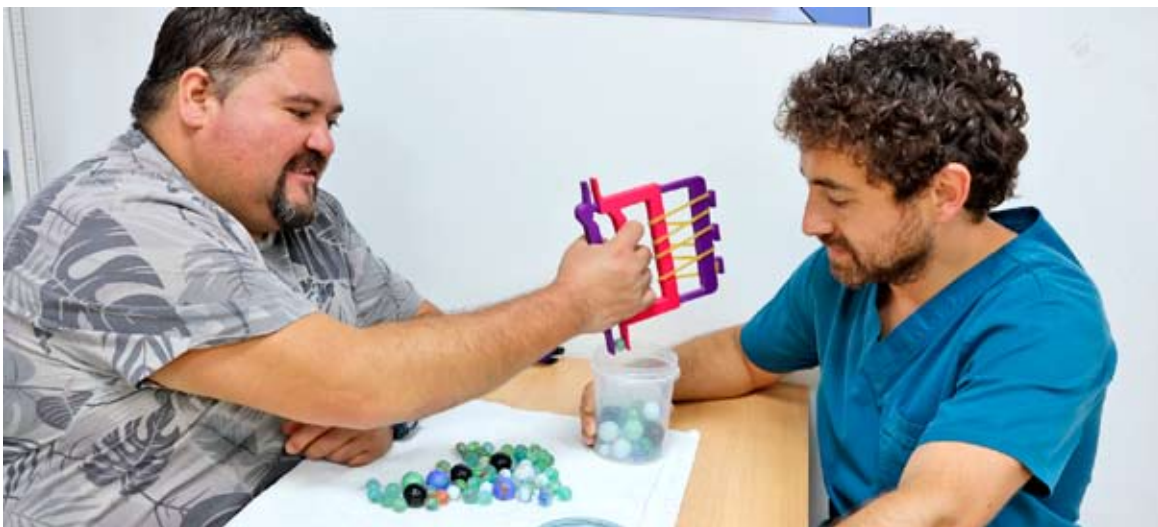
Nueva impresora Bambu Lab X1 Carbon permitió reducir los tiempos de impresión en más de un 60%.

La incorporación de nueva tecnología ha permitido reducir en casi 60% los tiempos de espera y mejorar la autonomía y calidad de vida de las y los usuarios.