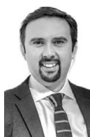
Oscar Crisóstomo Gobernador regional de Ñuble

T ras días de una lucha intensa y coordinada contra el fuego, hoy podemos informar, sin bajar la guardia, que en Ñuble solo persisten un foco activo que sigue siendo combatido. Esta contención es un primer triunfo colectivo, fruto del esfuerzo de Conaf, Bomberos, Fuerzas Armadas, Carabineros, policías, funcionarios públicos, la empresa privada y voluntarios. A todos ellos, nuestro profundo agradecimiento.