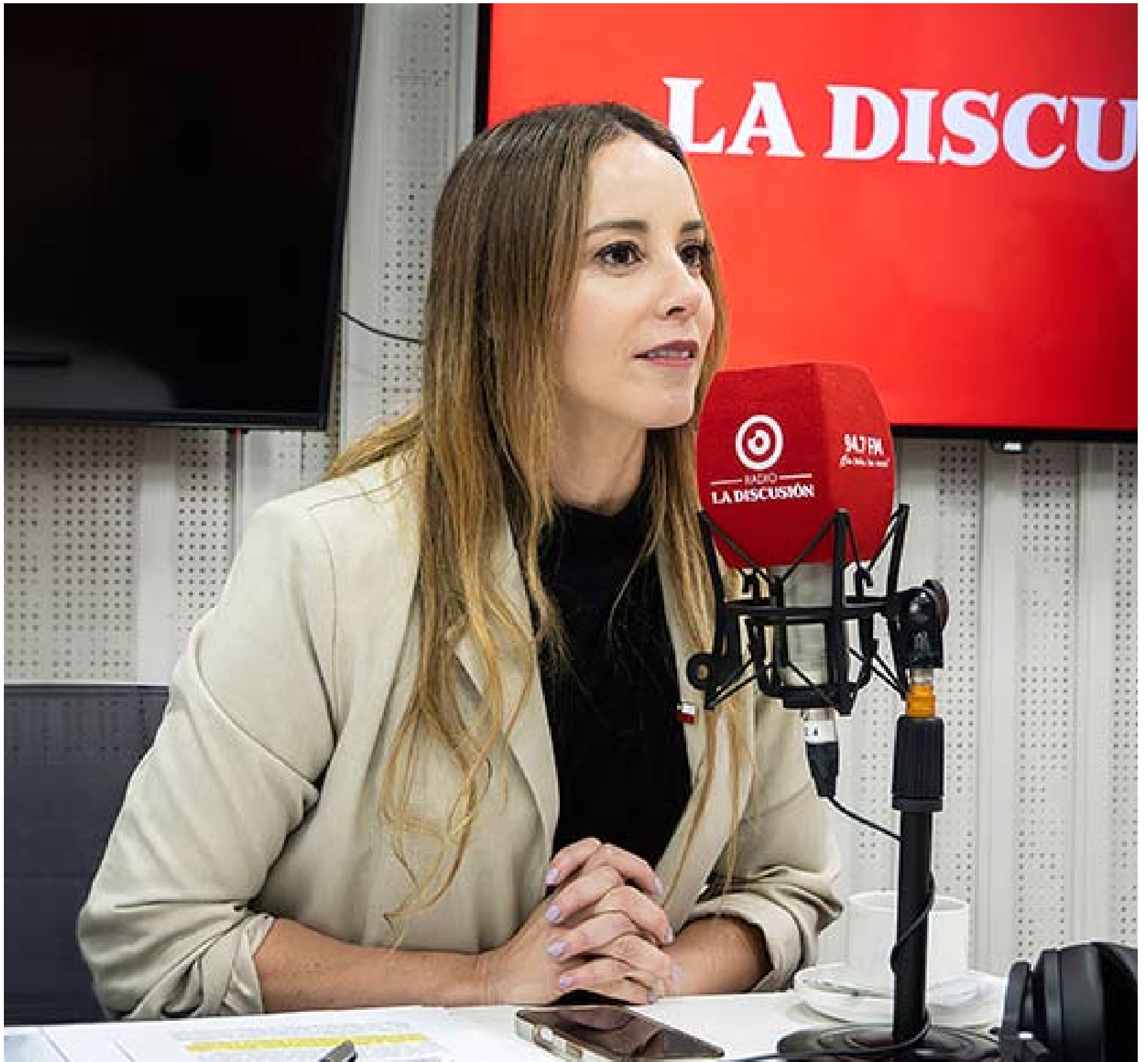
MARA SEDINI VIANCOS, MINISTRA SECRETARIA GENERAL DE GOBIERNO

"Auténtico". Así definió su estilo de vocería la ministra Mara Sedini, quien ha enfrentado un duro mes.