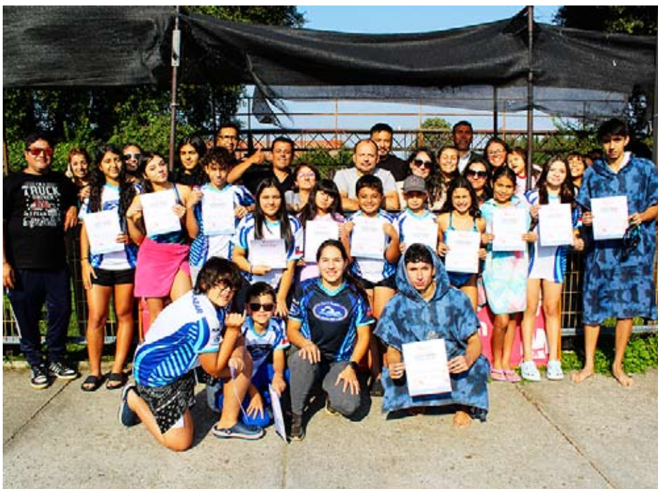
La instancia culminó con la entrega de certificados.