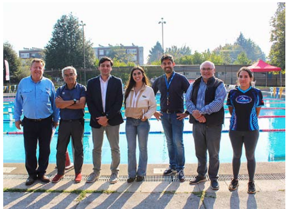
Autoridades de la UdeC y del municipio junto a docentes de natación.