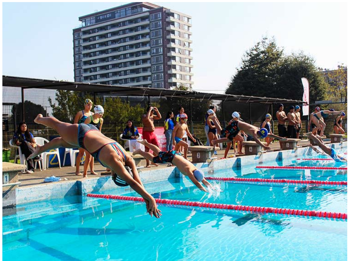
La jornada tuvo un gran interés de parte de las y los participantes.

La instancia culminó con la entrega de certificados a todas y todos los niños, niñas y adolescentes que participaron en el Primer Encuentro Escolar Comunal de Natación.