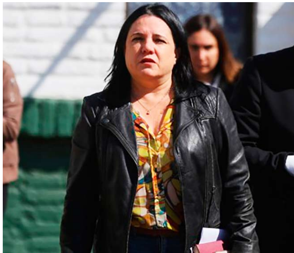
La ministra Steinert lideró este sábado una reunión con autoridades de Gobierno y policiales.

"Es sumamente importante que las personas que han ingresado en forma regular y realizan un trabajo honesto, bienvenidos sean; pero aquellos cuyo ingreso fue irregular, no corresponde y tenemos que realizar todas las acciones para que vuelvan a sus países", puntualizó Steinert.