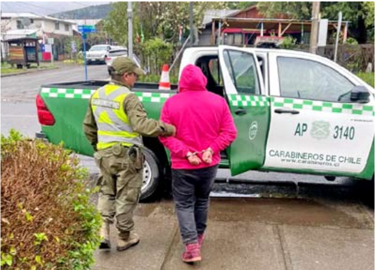
Se aplicaron más de 850 alcotest en la región.

El MOP destacó el crecimiento en el uso del sistema automático de pago TAG, que alcanzó un 79% durante la jornada. “Valorar el aumento del uso del pago mediante el dispositivo automático TAG que fue del 79%, de ahí reiteramos la invitación a la comunidad a adquirir sus dispositivos, de carácter gratuito, en las concesionarias Survías y Ruta Sur”, puntualizó Jelves.