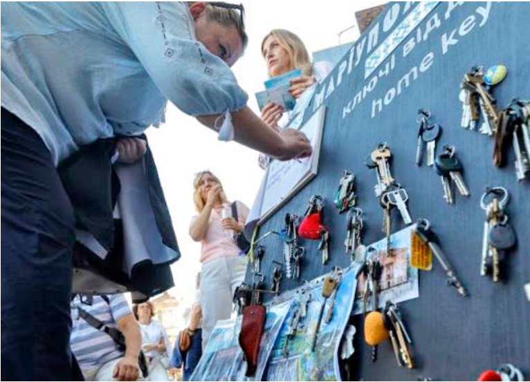
Estrategia obligar a las poblaciones locales a marcharse, agregó el responsable.