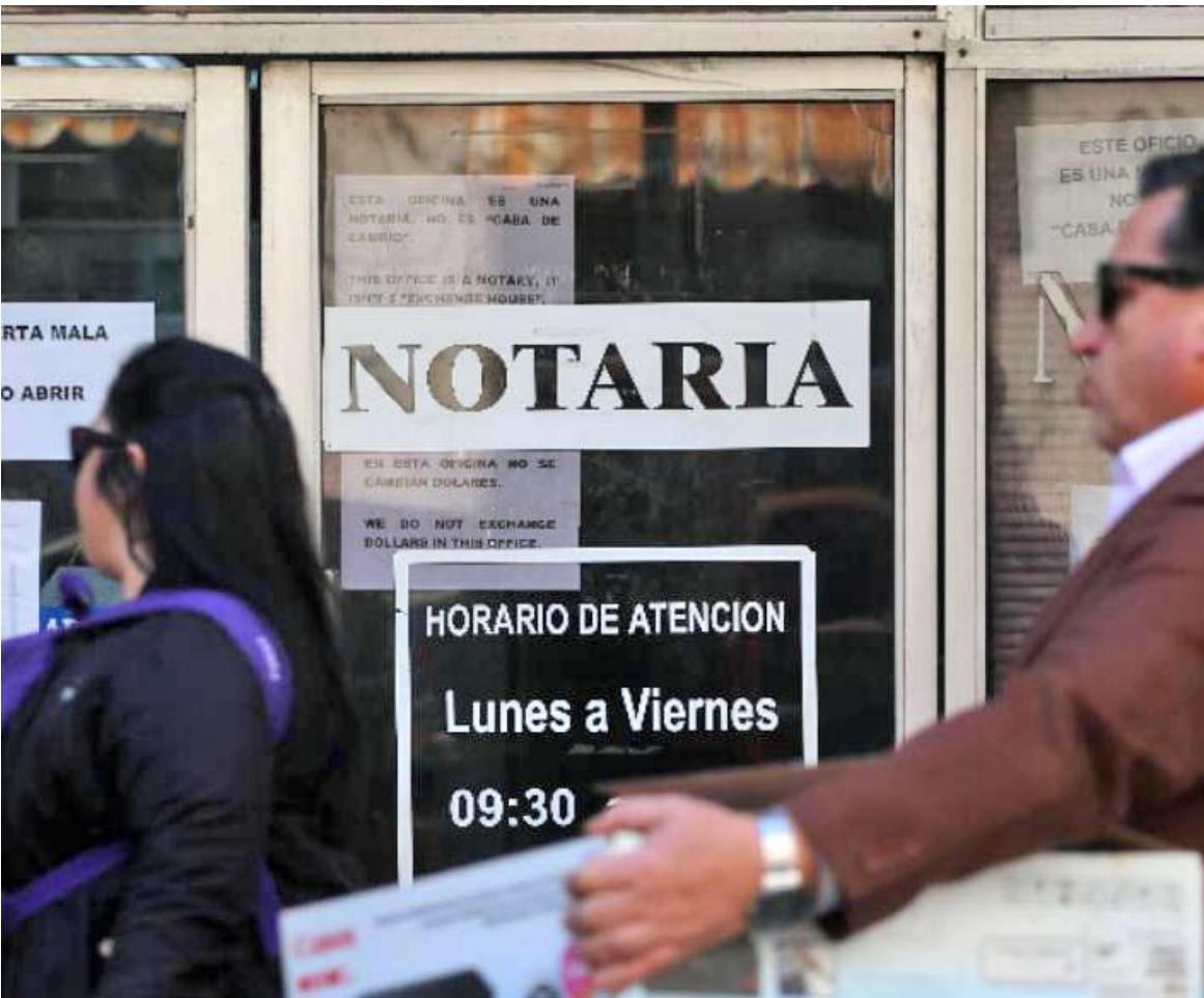
Una vez ejecutoriadas, las ternas serán remitidas al Ministerio de Justicia y Derechos Humanos.