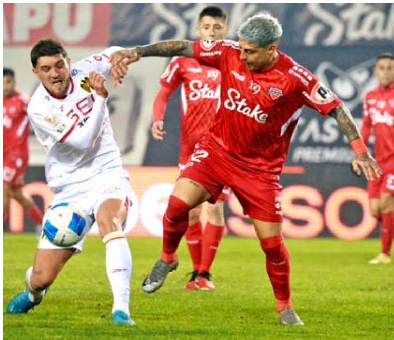
Ñublense está obligado a vencer a la UC el 9 de octubre de visita.