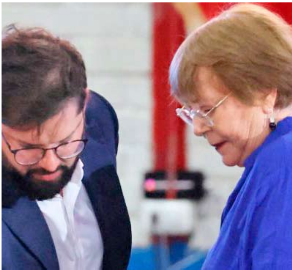
Desde el Ejecutivo expresaron que esperan una respuesta más clara de Bachelet sobre si emprenderá la candidatura.

En la oposición, el diputado Cristián Labbé (PNL) dijo que "las posibilidades de hacer gestiones