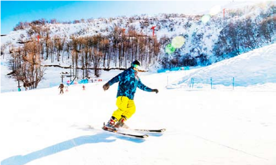
El grueso de los flujos de turistas durante julio se concentran en Valle Las Trancas-Termas de Chillán.

Un total de 70.583 pernoctaciones se registraron, durante julio, en los establecimientos de alojamiento turístico de la región, según reveló la Encuesta Mensual de Alojamiento Turístico (EMAT), que elabora el INE. Si bien se trata de la cifra más alta del año y una de las más altas de los últimos seis años, representó un descenso de 7,0% en comparación con julio de 2024, periodo en que las pernoctaciones alcanzaron 75.917, el peak desde febrero de 2019 a la fecha. De esta forma, Ñuble fue una de las ocho regiones del país que anotaron una baja interanual en las pernoctaciones. Sin embargo, en términos acumulados, entre enero y julio de 2025, las pernoctaciones en Ñuble suman 314.384, lo que representa un aumento de 8,4% respecto al mismo periodo de 2024. En cuanto a las llegadas de pasajeros, en julio sumaron 30.186, marcando una caída de 4,7% respecto a julio de 2024, también debido a la alta base de comparación. No obstante, la variación acumulada de los siete primeros meses del año alcanzó 7,8%. La tasa de ocupación en habitaciones, durante julio, registró un promedio regional de 39,6%, anotando una disminución de 0,4