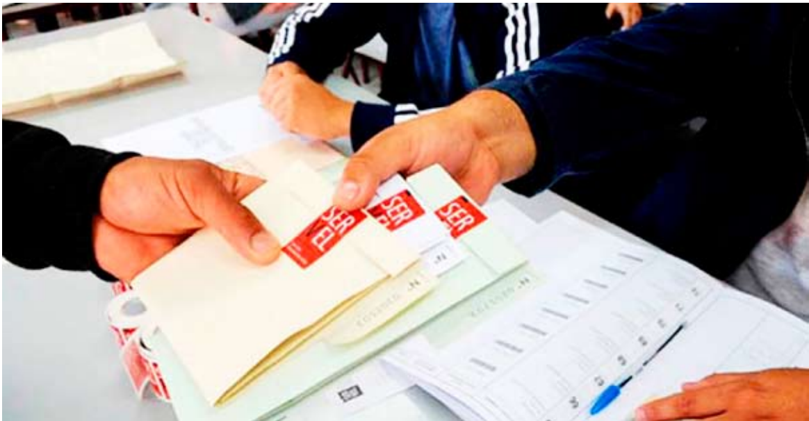
Cincuenta nombres para solo cinco cupos. La disputa por un lugar en la Cámara de Diputadas y Diputados será ardua.