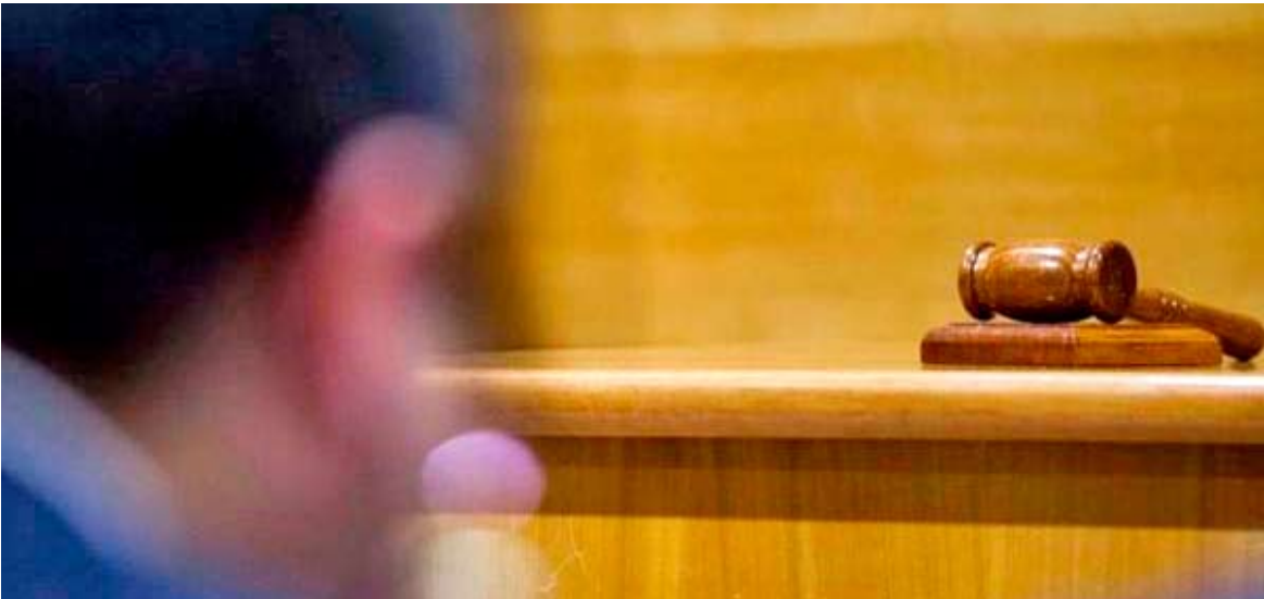
Al menos uno de los delincuentes portaba un arma de apariencia de fuego.

El 29 de abril de 2024 el grupo asaltó un local de máquinas de juegos de San Carlos, propiedad de un ciudadano chino. Les ordenaron que se tiraran al piso y amarraron a algunas de las víctimas.