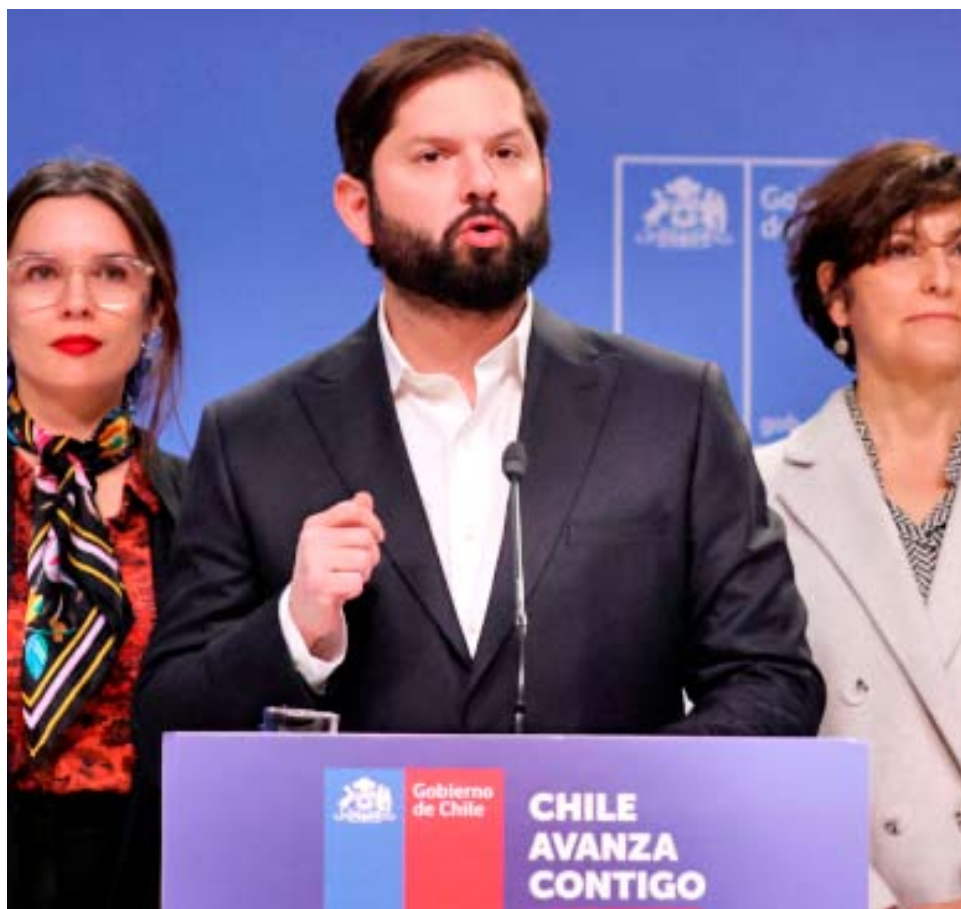
Boric no mencionó explícitamente a Kast, pero su mensaje se suma al de varios ministros que sí lo han hecho, lo que ha llevado al Partido Republicano a acusar intervencionismo.

El timonel del partido, Arturo Squella, denunció que “mientras más se involucre el Presidente Boric y sus ministros a la candidatura de Jeannette Jara, menos posibilidades tienen la posibilidad de ganar” la elección presidencial.