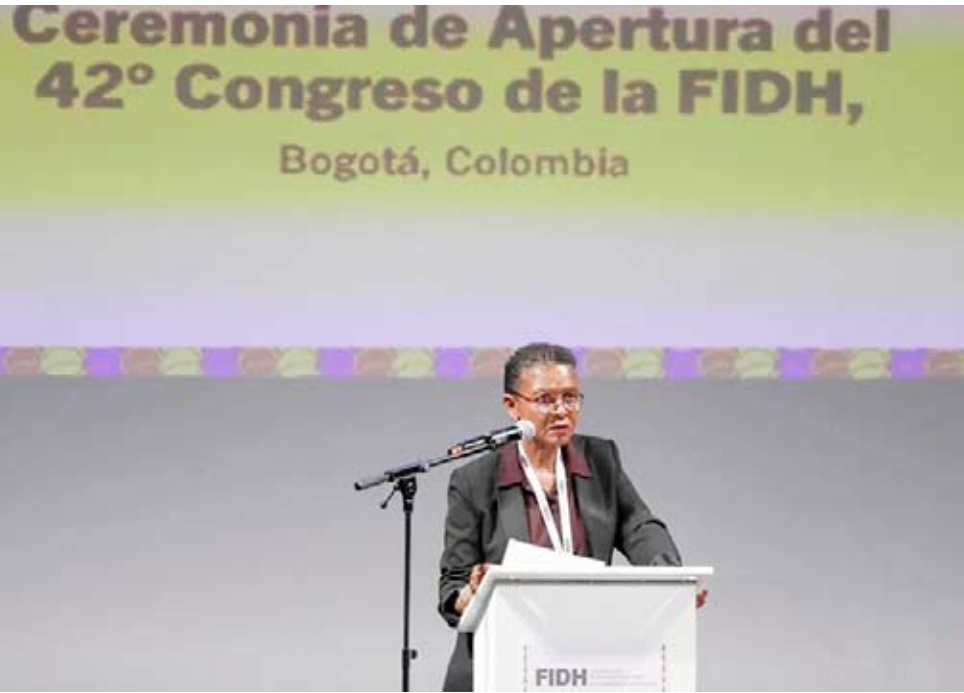
La presidenta de la FIDH, la botsuana Alice Mogwe, durante la inauguración del Foro.

El peso argentino abrió este lunes con una fuerte apreciación frente al dólar luego del contundente triunfo del presidente Javier Milei en las elecciones legislativas de medio término en Argentina, según las pizarras del estatal Banco Nación. En apenas media hora de operaciones, la ola vendedora hacía subir la moneda argentina 9,5% respecto a la previa de los comicios legislativos. La cotización enfrió semanas de una corrida cambiaria apenas contenida con el anuncio de un millonario auxilio financiero del gobierno de Estados Unidos, que el presidente Donald Trump había condicionado a un triunfo electoral de su aliado. En el Banco Nación la moneda argentina cotizaba a las 13H30 GMT a 1.370 pesos por dólar estadounidense, frente a los 1.515 del cierre del viernes. El gobierno de Milei obtuvo el domingo un fuerte respaldo de los argentinos que lo apoyaron con el 40,7% de los votos, frente a un peronismo disperso en varias listas que cosechó 31,7%. Aunque la victoria no le permitió sumar los escaños necesarios para tener mayoría en el Congreso, le proporcionará el número suficiente para promover reformas en los dos años de mandato que le restan, principalmente en áreas como laboral, tributaria y previsional. También le brinda el número necesario para bloquear un eventual pedido de juicio político y lo deja mejor posicionado para conseguir alianzas para sus iniciativas.