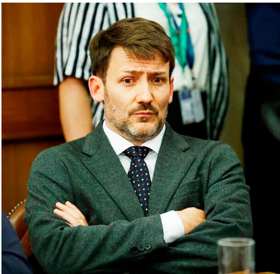
Si bien Pardow ya dejó el Gobierno, de ser aprobada arriesga cinco años de inhabilidad de cargos públicos.

"Esperamos también que voten a conciencia en favor de la ciudadanía y no en favor de un ministro que ha mostrado nada más que ineptitud",