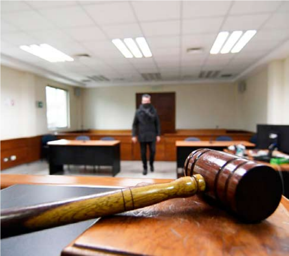
La audiencia de preparación de juicio oral se realiza en el Juzgado de Garantía de Bulnes, hasta el próximo miércoles de esta semana.