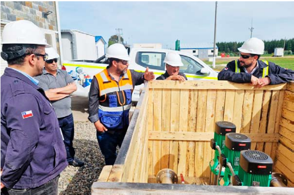
Falta dotar al sector de energía eléctrica trifásica, requisito indispensable para activar el sistema de presurización.

El aporte de este equipamiento es clave para mejorar la calidad y continuidad del suministro en la zona. Con esta entrega, solo resta un último paso para la puesta en marcha total del proyecto que