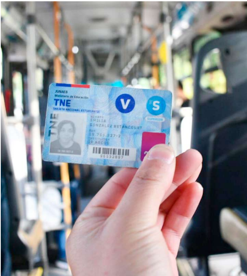
Aclaración por cuestionamientos sobre el uso “restringido exclusivamente para motivos de estudio”.

La Contraloría General de la República (CGR) emitió un comunicado donde aclaran el dictamen sobre el uso de la Tarjeta Nacional Estudiantil (TNE) o pase escolar. El dictamen de la CGR ratificaba la respuesta de la Subsecretaría de Transportes hacia un estudiante, donde se señalaba que el pase escolar puede usarse durante todos los días del año, pero sólo con fines académicos. Aunque se enfatizaba que “la empresa de servicios de transporte de pasajeros carece de facultades para exigir al estudiante acreditar tales motivos”. Ante esto, el ministro de Educación, Nicolás Cataldo, declaró que “vamos a resolver esa contradicción para solicitar una consideración nueva a la Contraloría General de la República en orden de poder alinear tanto el decreto 20 que regula el transporte escolar como también los instructivos de Junaeb” e hizo un llamado a “no generar normas que luego son infiscalizables”. Mediante un comunicado, la CGR argumentó que “aplicando la normativa vigente contenido en el Decreto Supremo N°20 de 1982, del Ministerio de Transportes, la TNE sí puede usarse las 24 horas del día, de lunes a domingo, y todos los meses del año, incluyendo enero y febrero”.