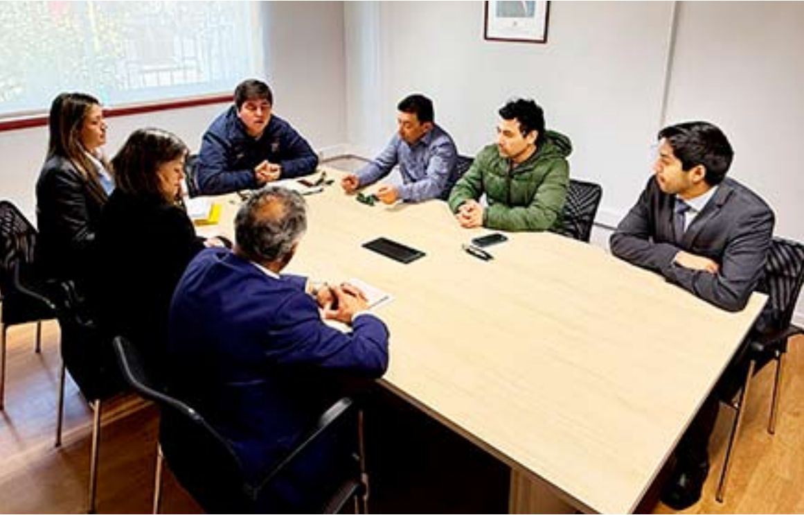
Gobierno entregó información a ediles, quienes habían manifestado dudas en torno al proyecto.

RECINTO PARA ESCUELA DE FORMACIÓN TEMPORAL