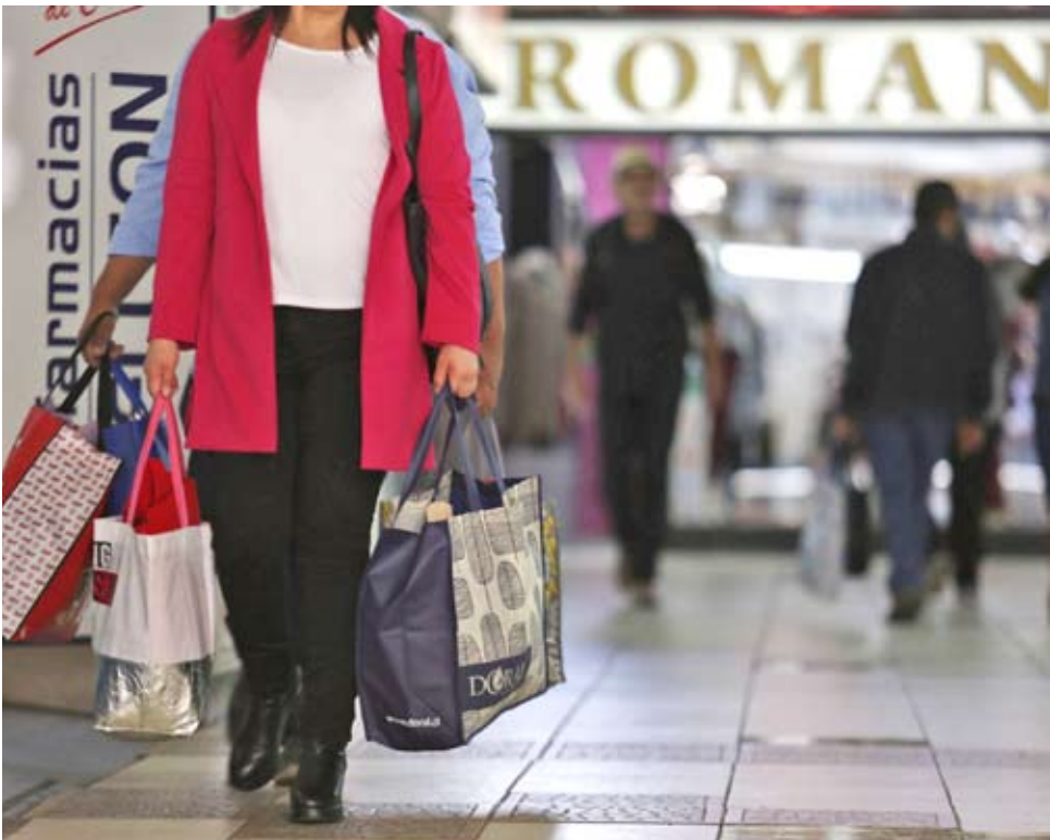
Chillán exhibió la tasa de morosidad más alta de la región, con 27,3% y 43.936 personas morosas.

promedio de $2.122.821, las más alta de la región. Le siguen Pinto ($2.081.870), Chillán ($2.054.510), Bulnes ($1.725.901) y San Carlos ($1.710.082).