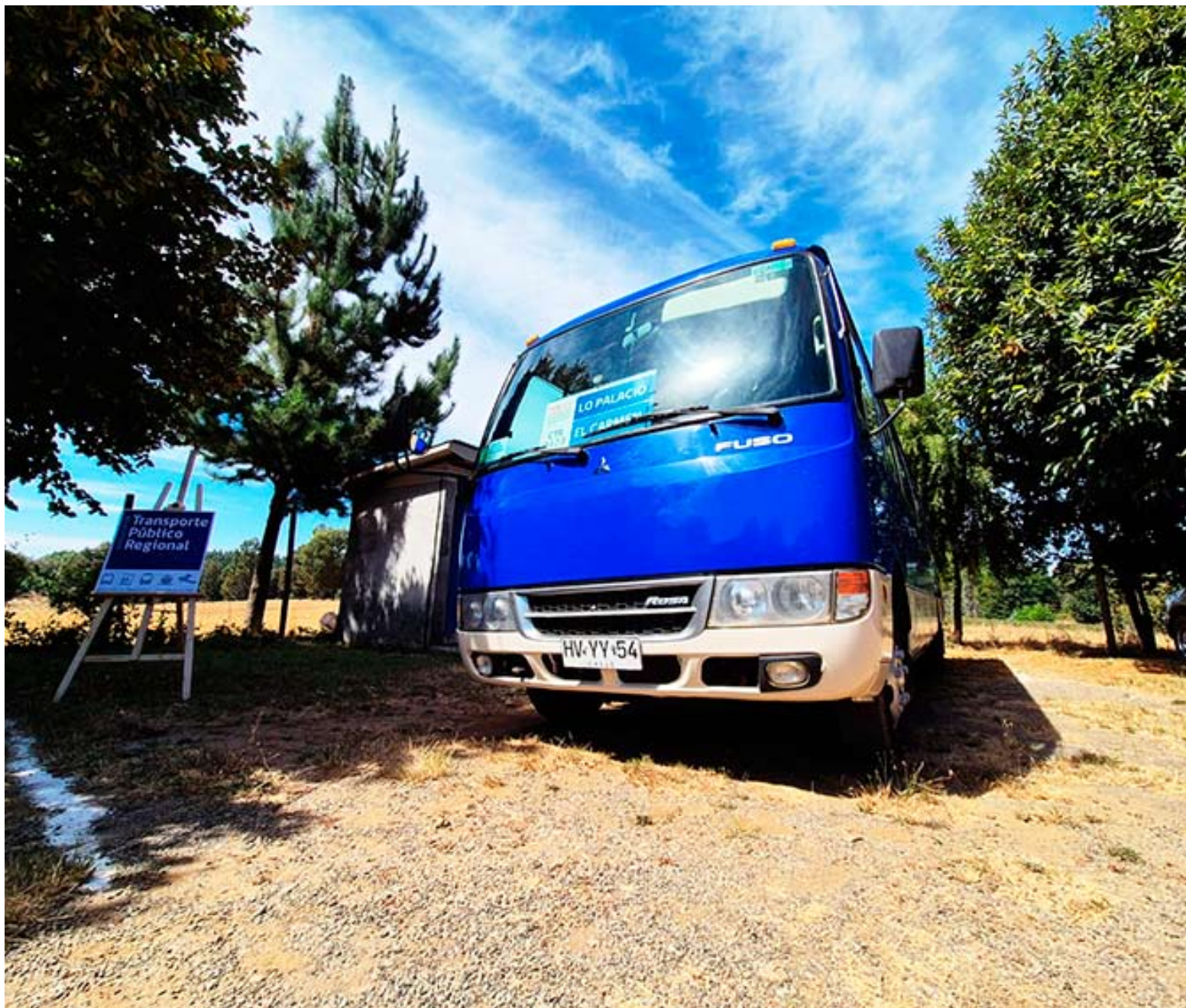
Gremio solicitará una mesa de diálogo con el Ministerio de Transportes.

"Es algo que actualmente está viendo el ministerio con los gremios, por lo que no es algo definitivo. Yo creo que se llegará a un acuerdo de ambas partes y que esta medida se va a revertir", indicó la autoridad regional.