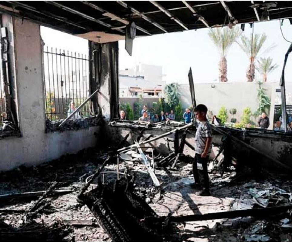
Casa de una familia palestina, incendiada por colonos israelíes en la aldea de Abu Falah.