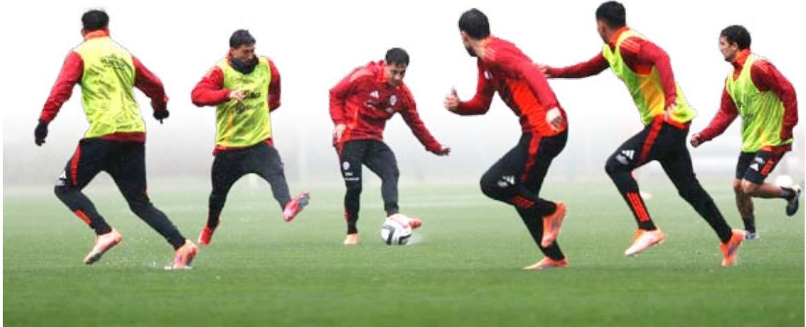
El elenco nacional jugará en territorio ruso sus últimos duelos de 2025.

se creía totalmente cerrada debido a las pésimas condiciones para que el "ingeniero" asuma en la Roja. Bravo: "Le paso las llaves" El arribo de Pellegrini aparece como la única esperanza de un trabajo serio. Ayer, el capitán de la generación dorada, Claudio Bravo, le dio todo su respaldo a la idea de contar con el técnico del Betis de España. "Si me tocara ser el presidente de la Federación de Chile, le paso las llaves a Manuel Pellegrini, le construyo un complejo diseñado por él y que haga y deshaga con el fútbol chileno en las divisiones menores y adultas", dijo en su rol de panelista de ESPN. Bravo contó que Manuel Pellegrini "siempre ha estado muy pendiente del fútbol chileno, de la selección".