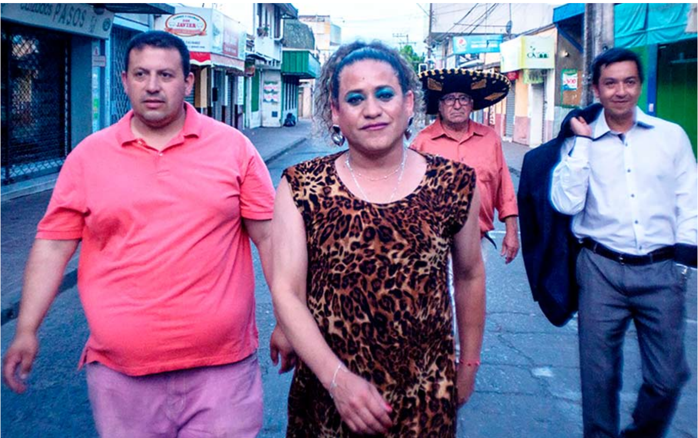
La película de Alzamora se mostrará en distintas ciudades del país y para las personas sordas.

Tras un proceso de reflexión junto a distintos centros culturales del país para avanzar en la eliminación de las barreras de acceso al cine que enfrentan las personas con discapacidad auditiva, el Ministerio de las Culturas, las Artes y el Patrimonio, a través del programa Red Cultura del Departamento Ciudadanía Cultural, organizó en seis comunas la exhibición de la película chilena “Denominación de origen”, en una versión especialmente adaptada con subtítulos descriptivos para la comunidad sorda. La iniciativa busca promover espacios de convivencia y respeto por la diversidad, donde personas sordas y oyentes puedan compartir la experiencia cinematográfica. La incorporación de subtítulo, junto con otros recursos como intérpretes de lengua de señas y metodologías accesibles, enriquecen la participación ciudadana y promueven el reconocimiento de la diversidad cultural y lingüística del país.