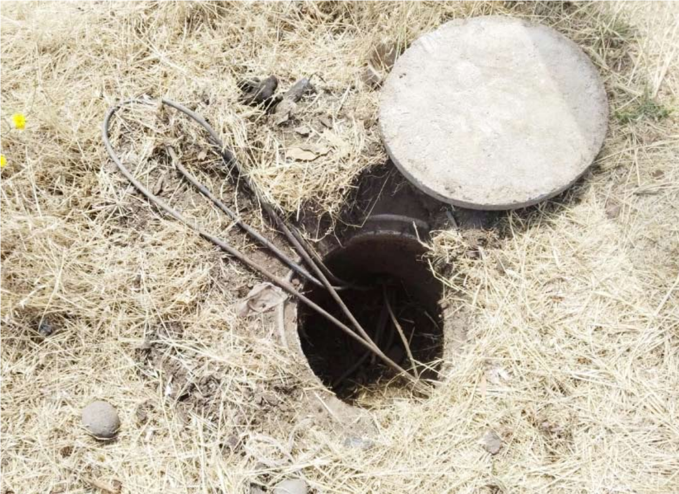
Robo es un riesgo para la seguridad vial y el normal funcionamiento de las actividades productivas del sector.

Sustracción dejó sin alumbrado público el bandejón central que divide ambas calzadas, afectando directamente a empresas e industrias ubicadas a lo largo de los dos kilómetros de extensión.