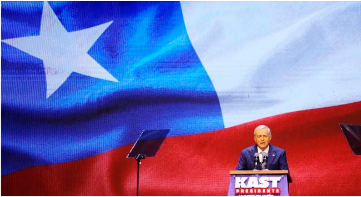
Victoria sigue el camino de otros países de América Latina.

México: el 1 de octubre de 2024 asumió el poder Claudia Sheinbaum, quien continúa el proyecto del anterior presidente mexicano, Andrés Manuel López Obrador, del Movimiento Regeneración Nacional (Morena), un partido de izquierdas.