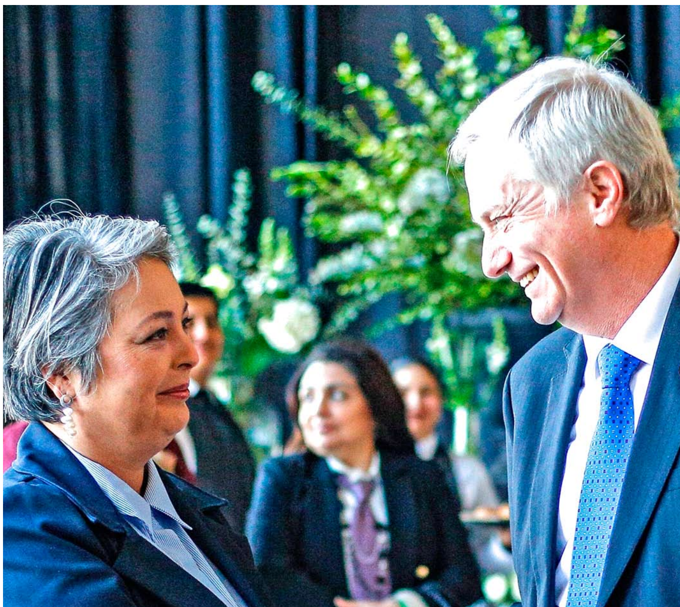
En una escueta reunión, Jeanette Jara visitó al Presidente electo, José Antonio Kast en su comando en la comuna de Las Condes.

Y también tuvo palabras para el electorado. “A quienes hoy están contentos, felices, celebrando, mis felicitaciones mis sinceras felicitaciones. A quienes hoy tienen pena, están tristes, tienen incertidumbre, quiero decirles también que hay muchos motivos por los que seguir trabajando por nuestra patria y siempre estaremos juntos en ello y sobre todo que somos un solo país, que Chile es de todos y de todas y tenemos un destino común que no puede prescindir de quienes piensan distinto”.