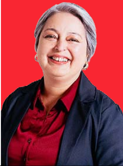
Jeannette Jara Román 5.216.624 votos

Votos validamente emitidos: 12.470.072 votos