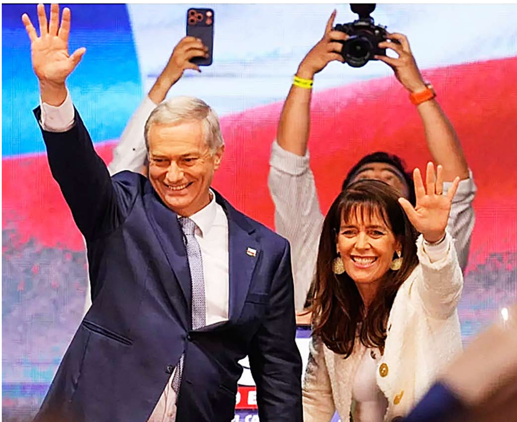
Un largo discurso de 55 minutos brindó el Presidente electo, José Antonio Kast Rist.

No nos pidan milagros. Pídanos trabajo, energía, consecuencias y valentía para unir al país, para recuperar la tranquilidad, el crecimiento y la esperanza que Chile nos exige hoy"