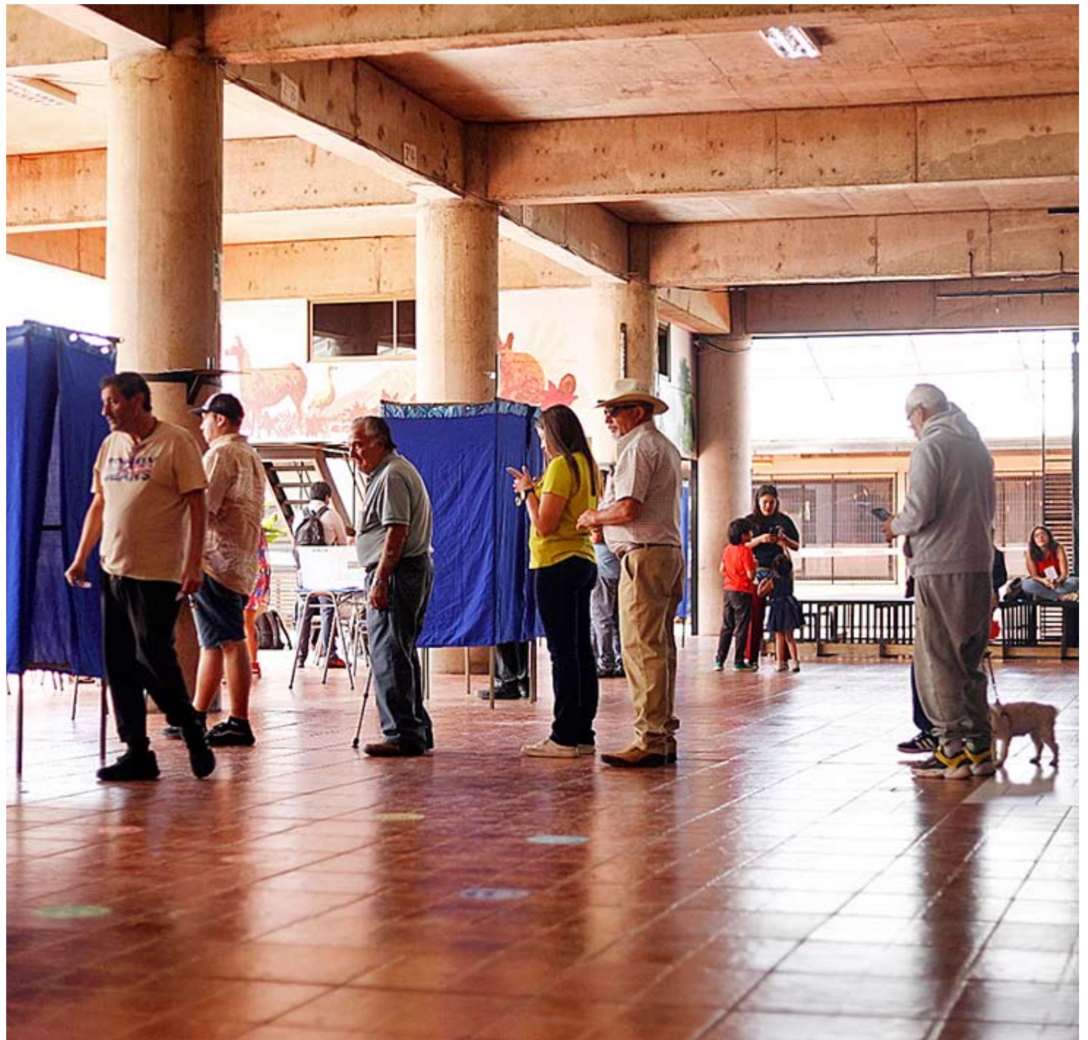
En Chillán la participación alcanzó un 88,97%.

En opinión de analistas locales, el voto obligatorio es el principal factor de la alta participación,