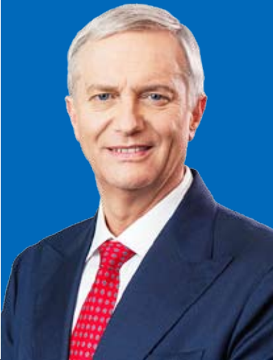
José Antonio Kast Rist 264.411 votos

Resultado elección Presidente de la República Región de Ñuble 99,83% de las mesas escrutadas