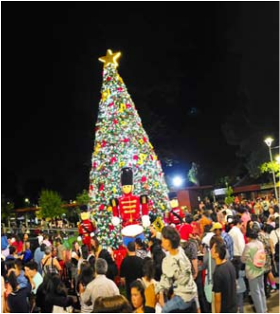
El Carmen enciende la Navidad con árbol de 12 metros. Cientos de familias carmelinas se hicieron presente en el encendido de luces del árbol navideño comunal 2025, emplazado en la Plaza de Armas de El Carmen, hito con el cual se dio inicio al lanzamiento de las actividades preparadas por el municipio para esta Navidad.

¿Está de acuerdo con habilitar el tránsito vehicular en el tramo 1 del Paseo Arauco?