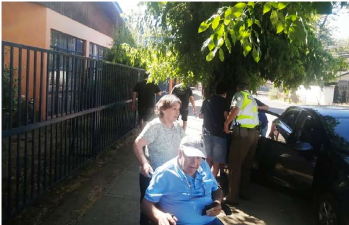
La jornada también evidenció los desafíos de accesibilidad para personas mayores con discapacidad.

“Pienso de que tiene que ser igual nomás, porque ya tenemos la preferencia y hemos ido avanzando, basta que uno aparezca y el vocal te llama.