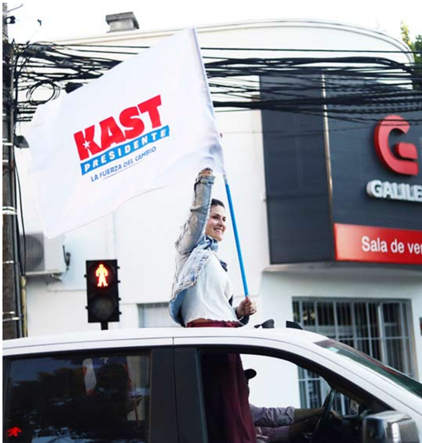
Cientos de adherentes de José Antonio Kast se reunieron en la Plaza de Armas de Chillán para festejar el triunfo.