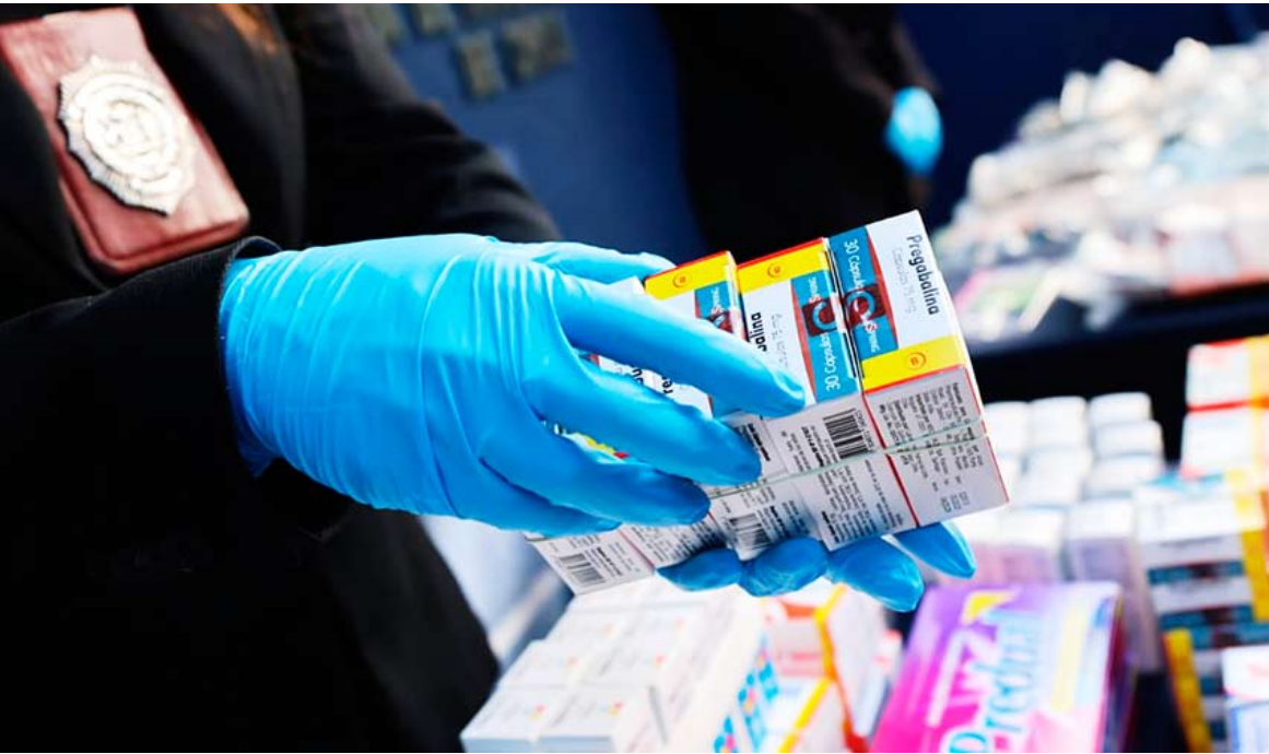
Se trata de la mayor incautación de este tipo de productos que se haya realizado en la Región de Ñuble.

RED CON BASE EN SANTIAGO ERA APOYADA POR FARMACIAS