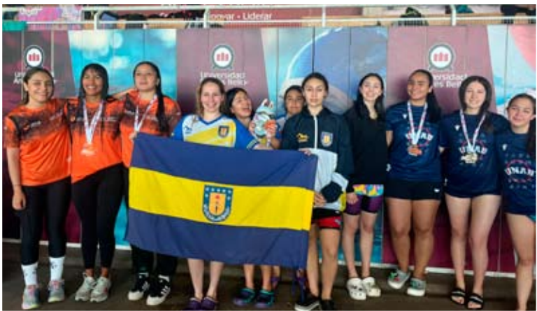
Primer lugar en relevo femenino.

Cabe destacar que en 2025 se cumplen 50 años desde que comenzó la disciplina de natación en el Campus Chillán.