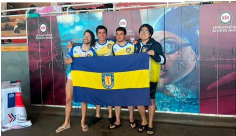
Segundo lugar en relevo masculino.