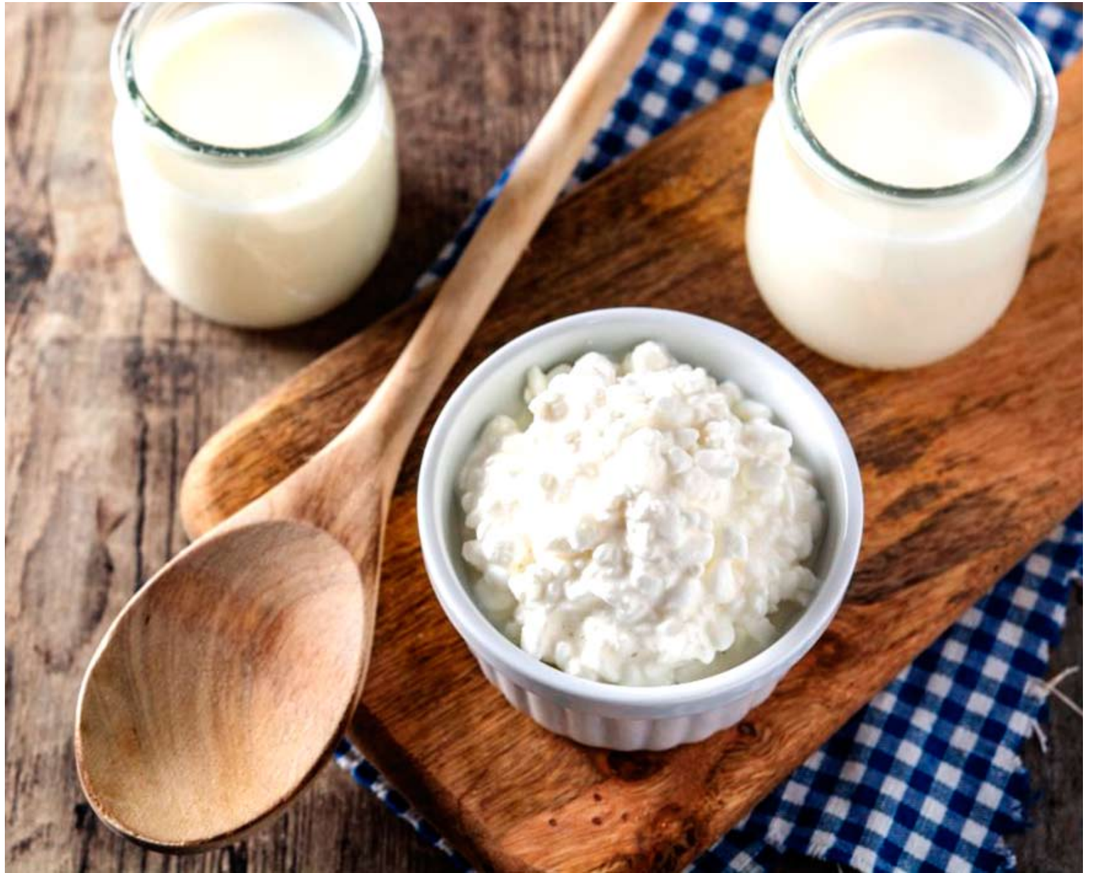
Bebida, hecha por una comunidad de microorganismos, es abundante en probióticos

Es por esto de que el kéfir en sí se considera como un alimento