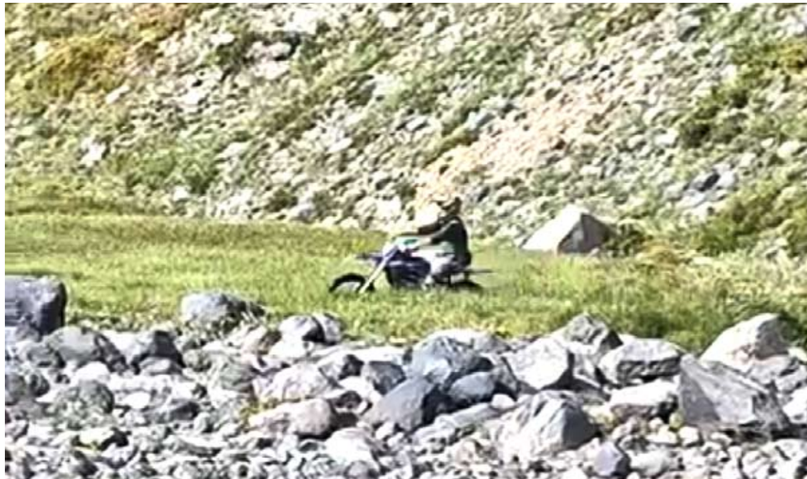
En Aguas Calientes fue sorprendido un grupo de motociclistas el fin de semana.

El monitor solicitó a las autoridades intervenir con una mayor fiscalización