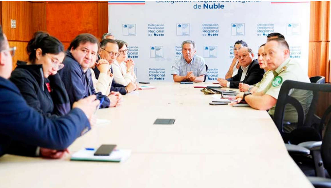
Para el domingo son los mismos locales, las mismas mesas y los mismos vocales de mesa.

LOCALES SERÁN RESGUARDADOS DESDE LAS 09.00 DEL VIERNES