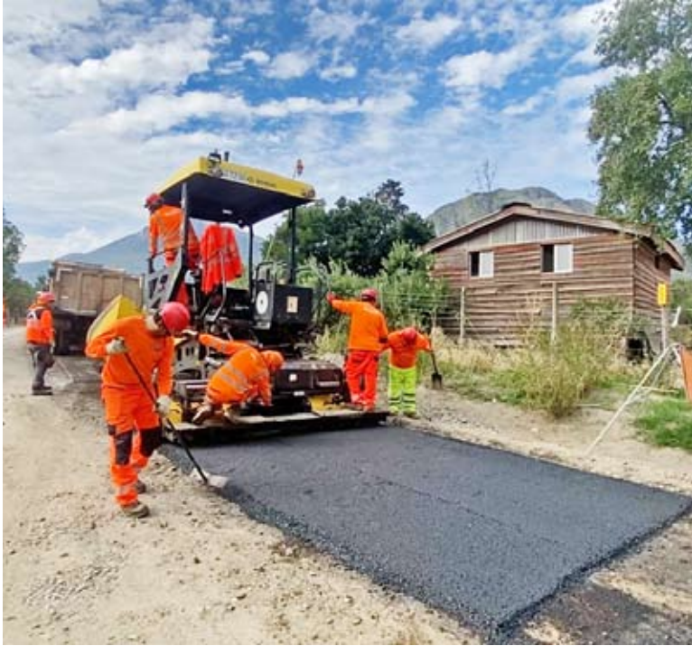
En total, el bienio 2024-2025 suma más de 244 kilómetros.

Ñuble cerrará el año 2025, según cifras de la Dirección de Vialidad del Ministerio de Obras Públicas, con 137 kilómetros de nuevos caminos pavimentados, superando los 107 kilómetros construidos en 2024. En total, el bienio 2024-2025 suma más de 244 kilómetros. Este incremento de un 27% más de pavimentaciones que el año pasado, responde a una cartera de contratos que abarcó obras de conservación y mejoramiento en diversas rutas estratégicas, incluyendo la N-520, N-296, N-438 y N-947, entre otras, beneficiando a sectores rurales donde la conectividad resulta clave para el transporte, la salud, la educación y las actividades productivas. El seremi de Obras Públicas de